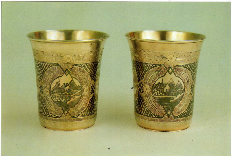
Фото 3. СТАКАНИ Срібло, позолота, воронювання, гравірування Україна. Житомир. Майстер невідомий. 1868