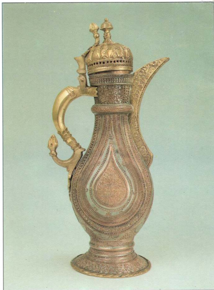
Фото 18. ГЛЕЧИК СХІДНИЙ