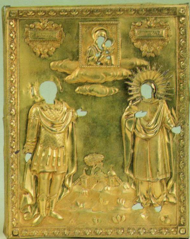
Фото 7. ОКЛАДИ ДО ІКОН