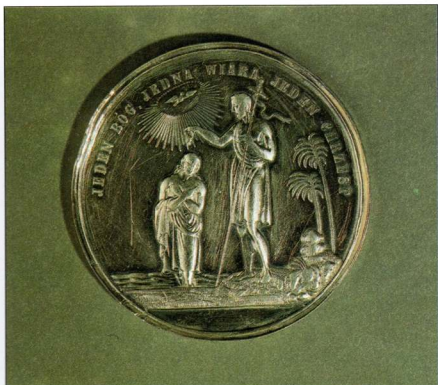
Фото 13. МЕДАЛЬ ХРЕСТИЛЬНА Срібло, карбування Польща. 1875