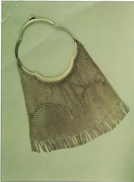
Фото 11. ТОРБИНКА