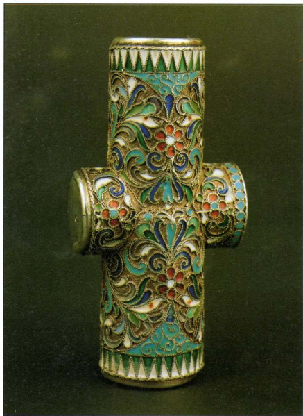
Фото 5. ПОРТСИГАР Срібло, емаль Росія. Москва. І.Д.Салтиков. 1891