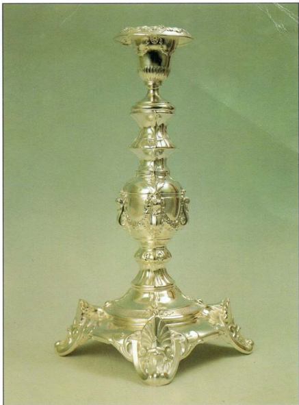
Фото 15. ГЛЕЧКИ ДЛЯ ВЕРШКІВ Срібло, карбування, гравірування Західна Європа. XIX ст.