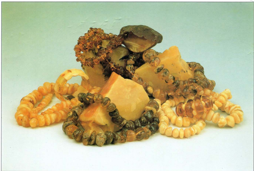
Фото 23. УКРАЇНСЬКИЙ БУРШТИН

Фото 20. КОМПОЗИЦІЯ "Георгій" Шкіра, мідь, емаль Україна. Київ. Т.Н.Колечко. 90-ті рр.