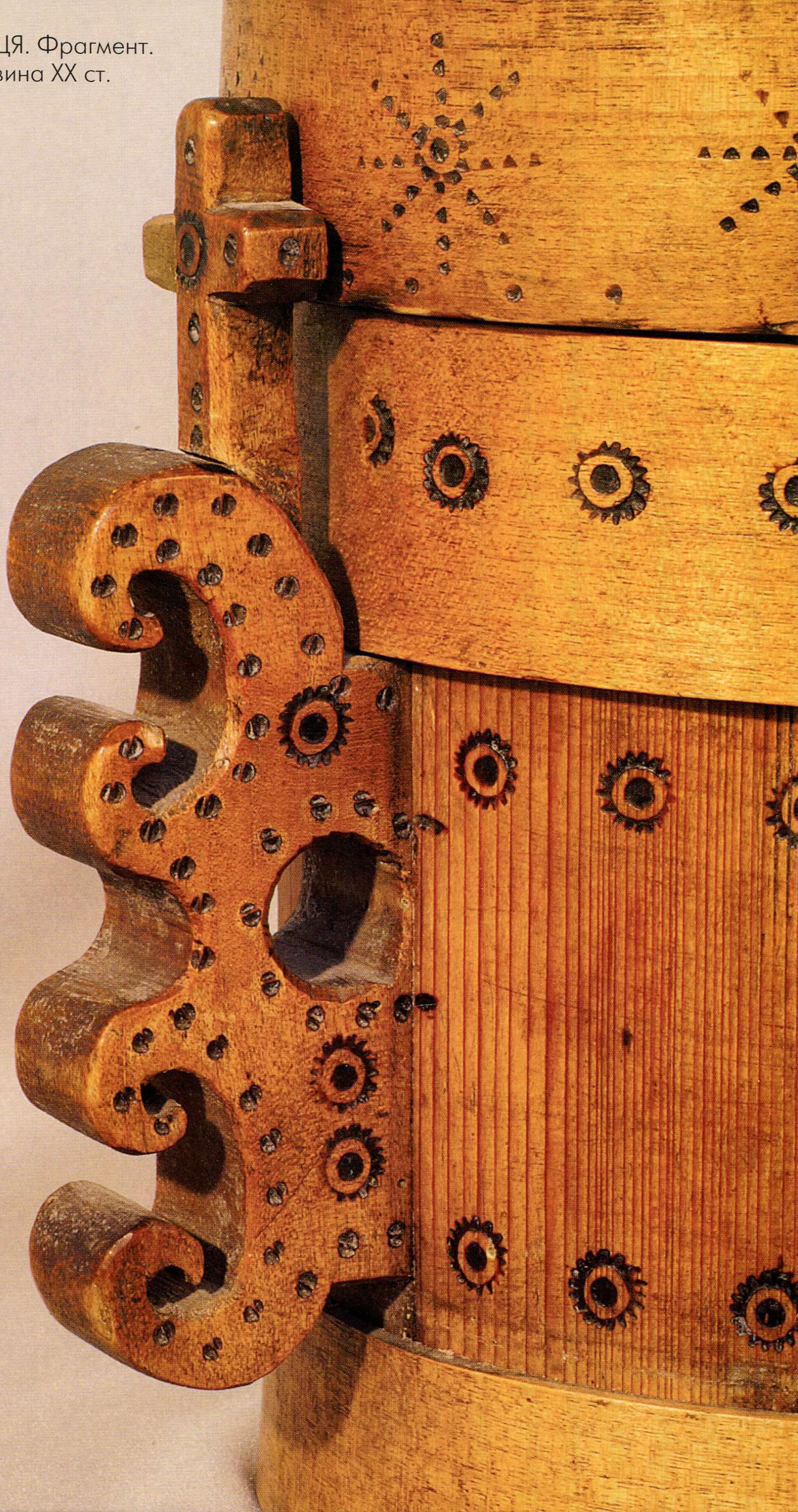
ПАСКІВНИЦЯ. Фрагмент. Друга половина ХХ ст.