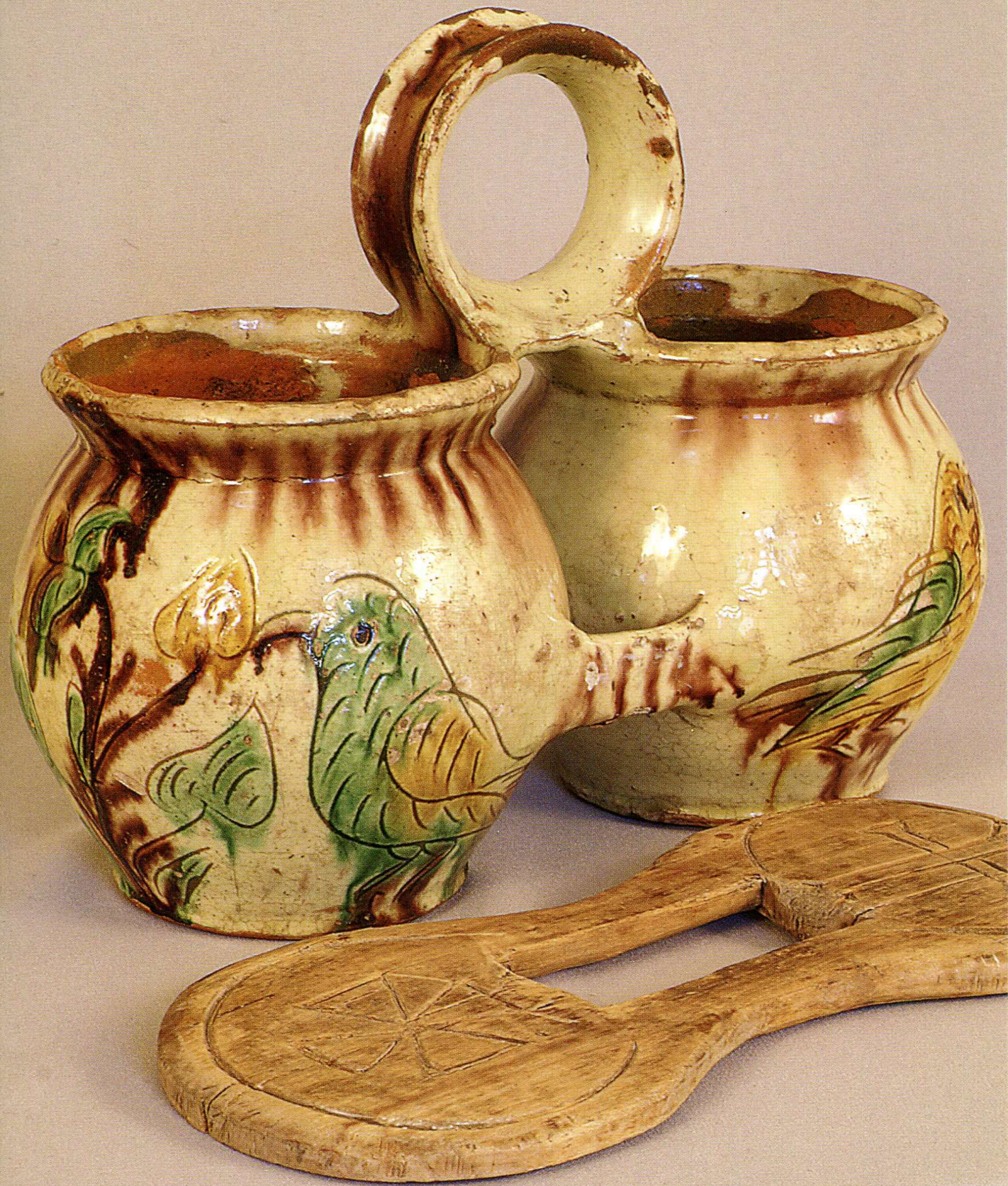
ВАСИЛЬ ШОСТОПАЛЕЦЬ. ГОРЩИКИ-ДВІЙНЯТА. 1872 рік.