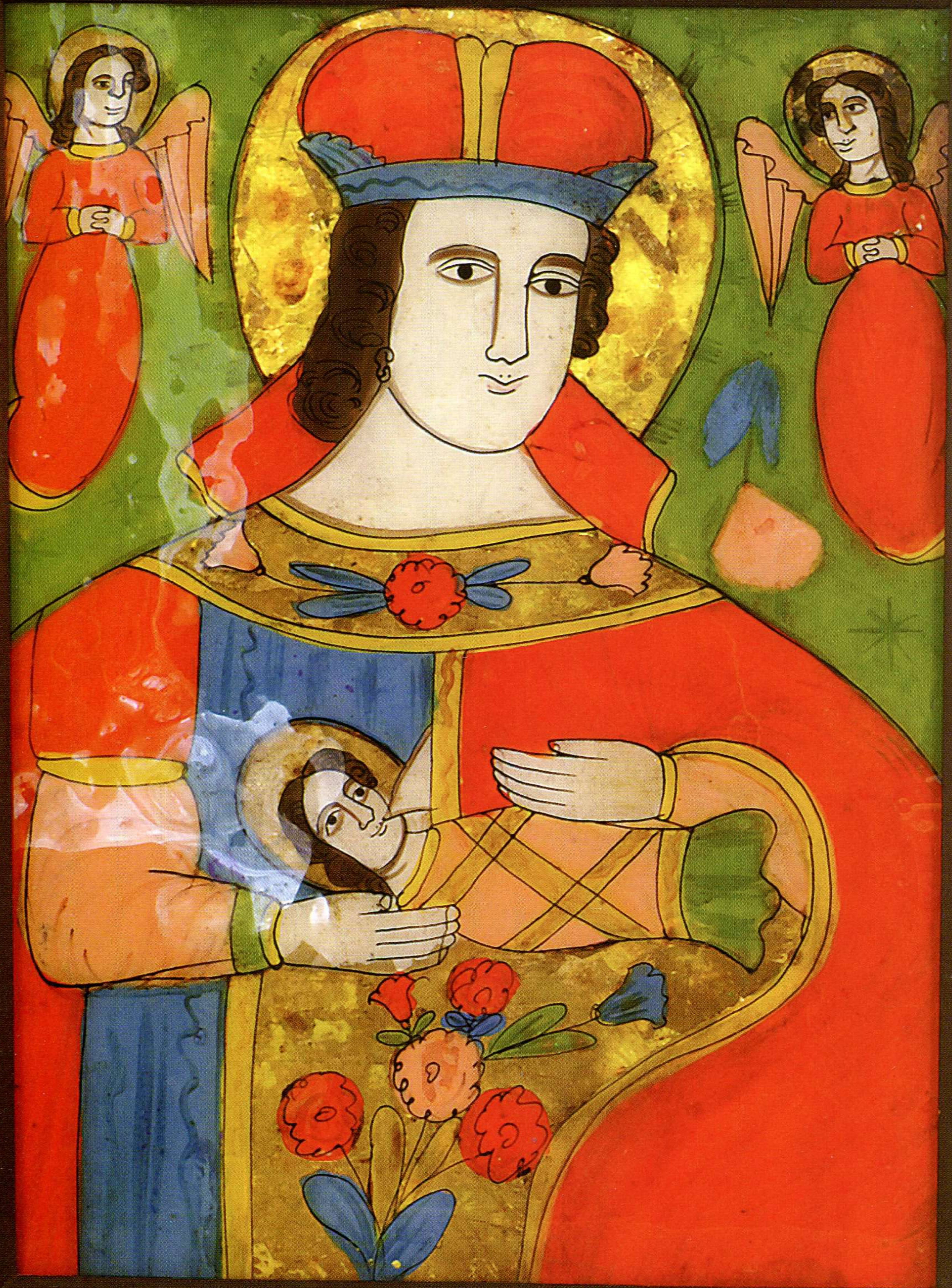
ІКОНА «БОГОРОДИЦЯ З ДИТЯМ». Друга половина ХІХ ст.