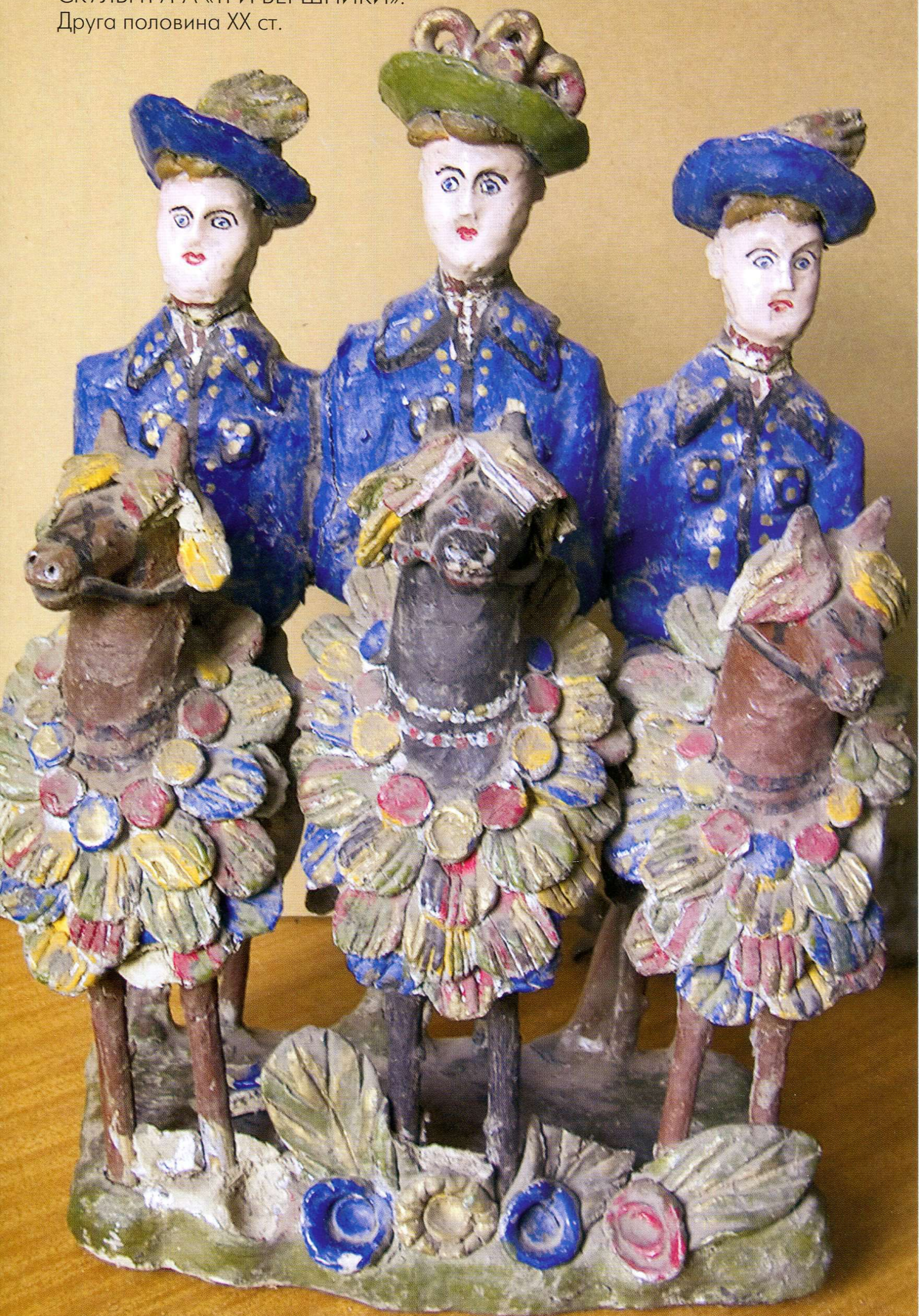
МАРІЯ КОВАЛЬЧУК. СКУЛЬПТУРА «ТРИ ВЕРШНИКИ». Друга половина ХХ ст.