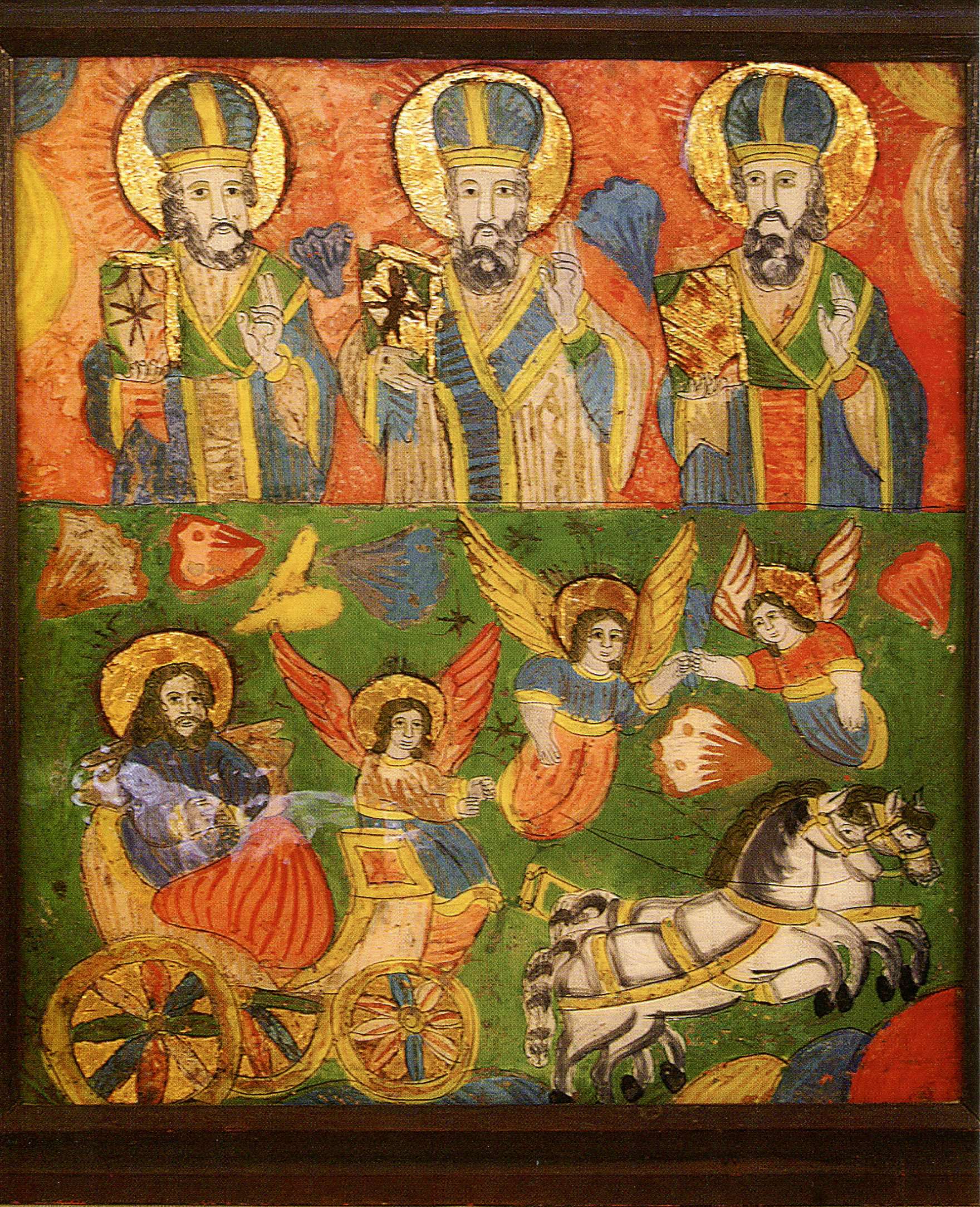
ІКОНА ДВОДІЛЬНА «ТРОЄ СВЯТИХ (?), «СВ. ІЛЛЯ НА КОЛІСНИЦІ». ХІХ ст.