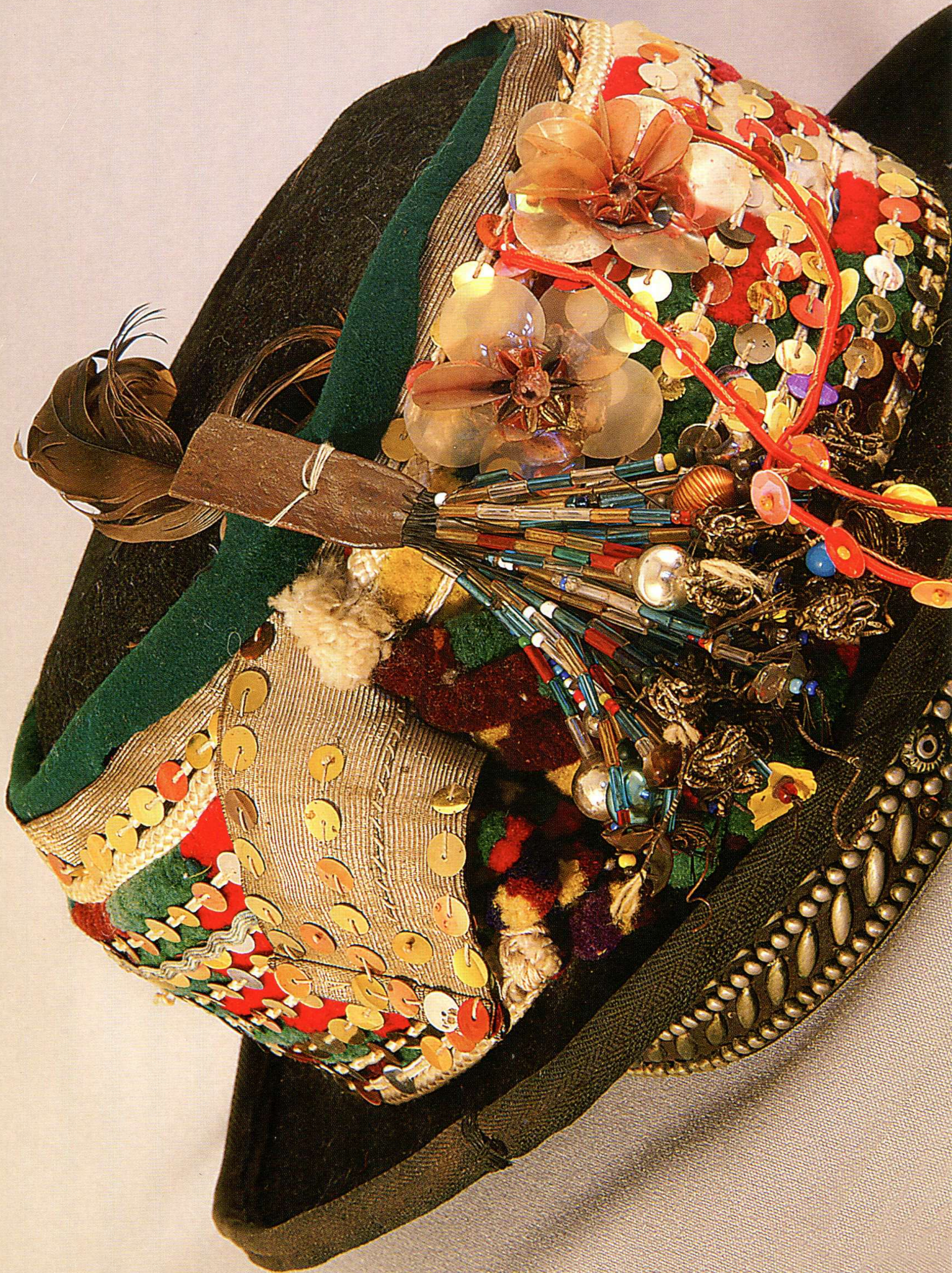
КАПЕЛЮХ ЧОЛОВІЧИЙ — «КРИСАНЯ». Перша половина ХХ ст.