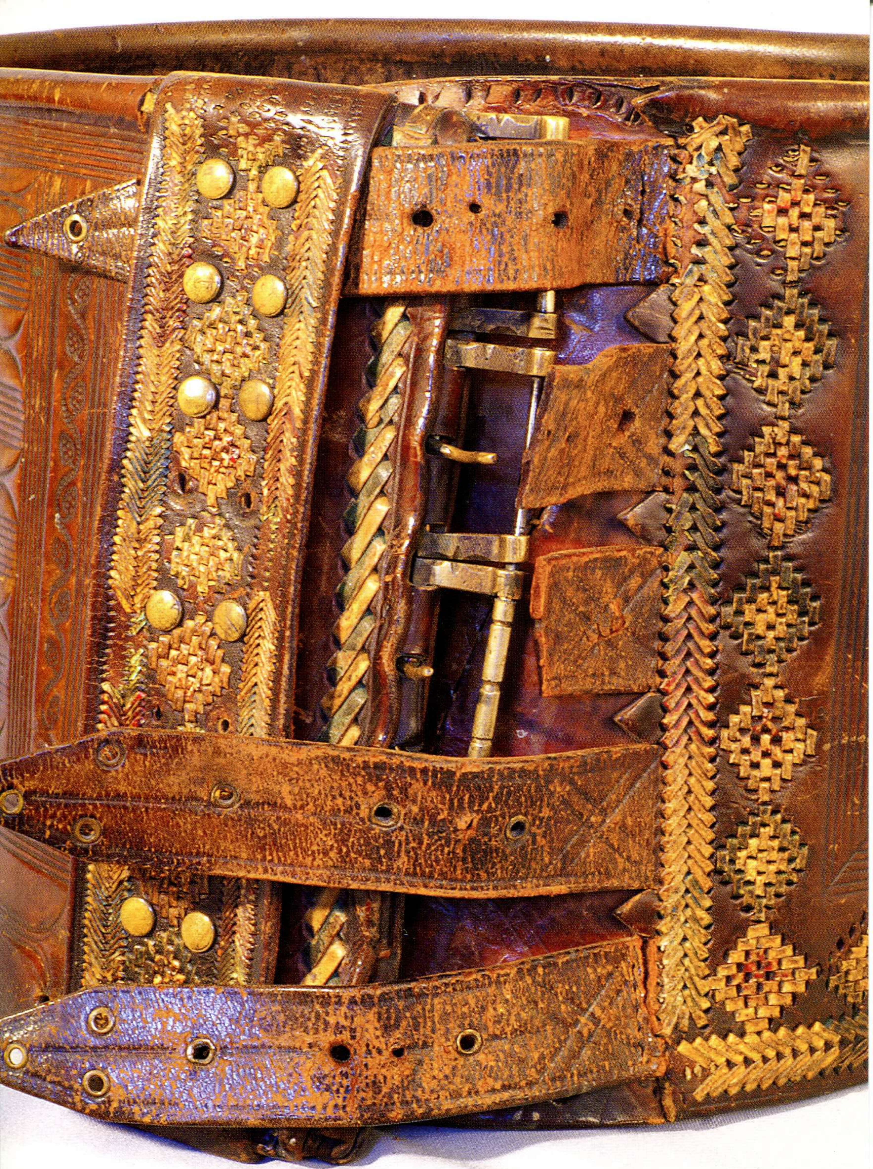
ПОЯС ЧОЛОВІЧИЙ — «ЧЕРЕС». Перша половина ХХ ст.