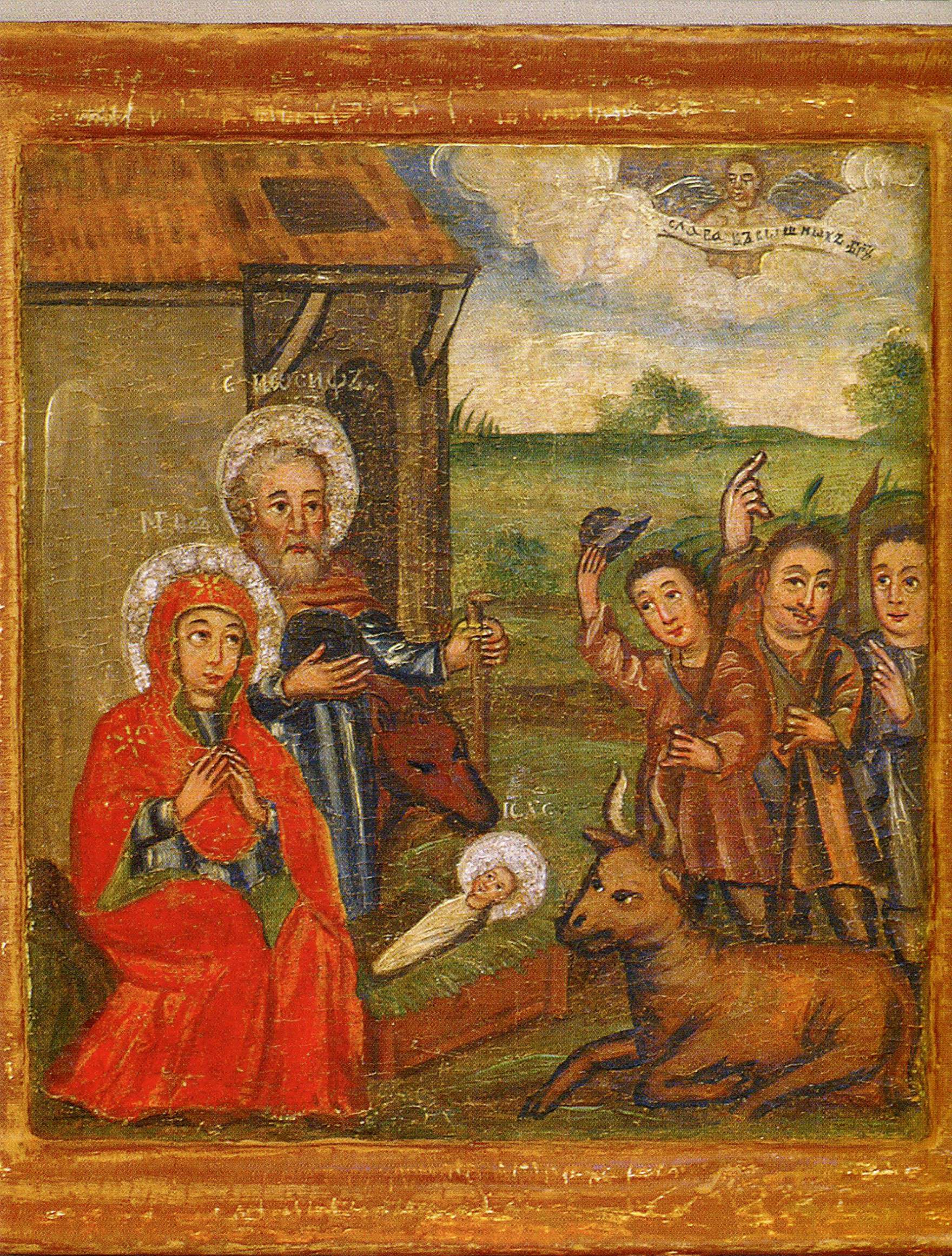
ІКОНА «ПОКЛОНІННЯ ПАСТУХІВ». Друга половина XVII ст.