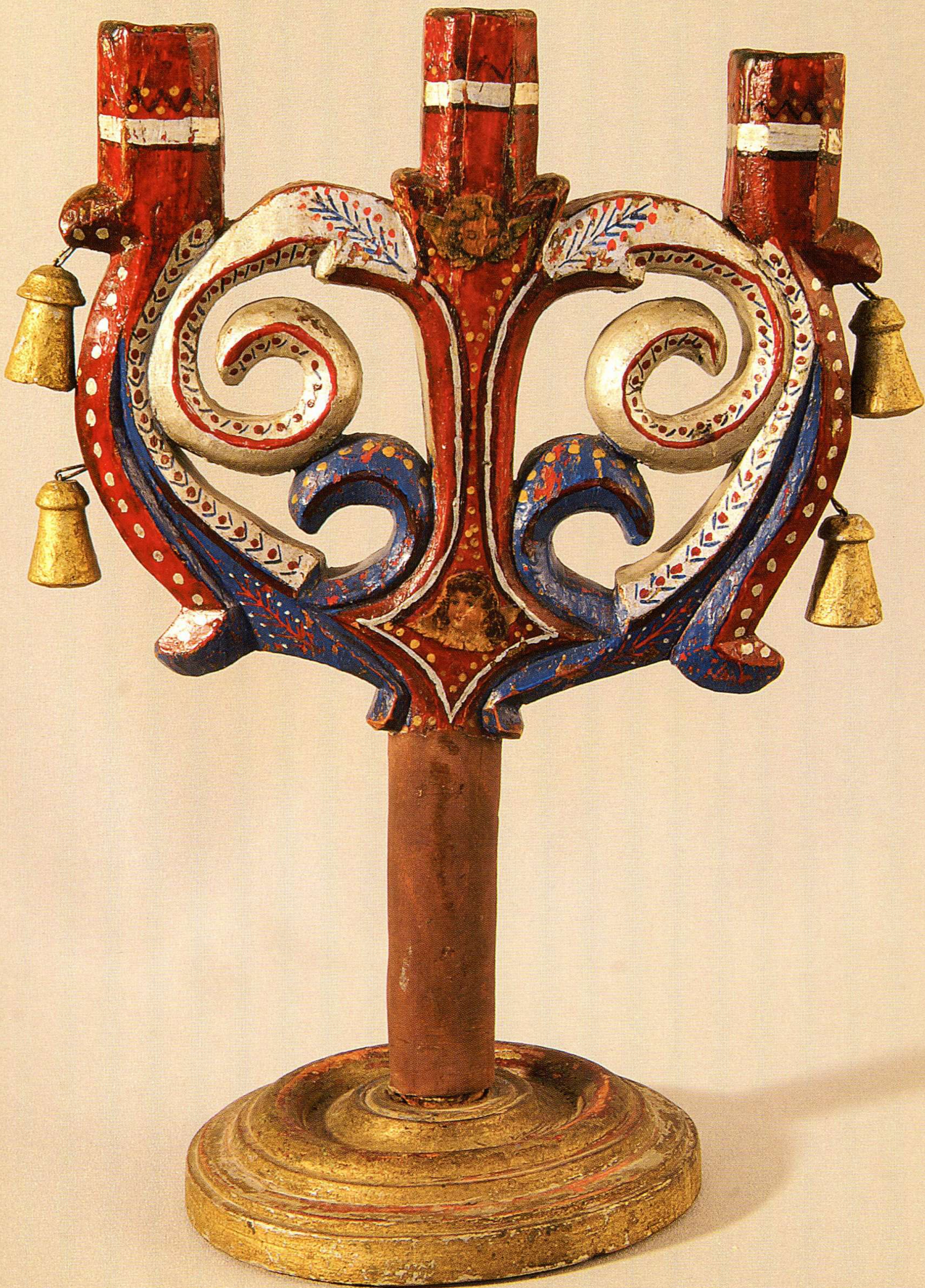
СВІЧНИК-ТРІЙЦЯ. Початок XX ст.