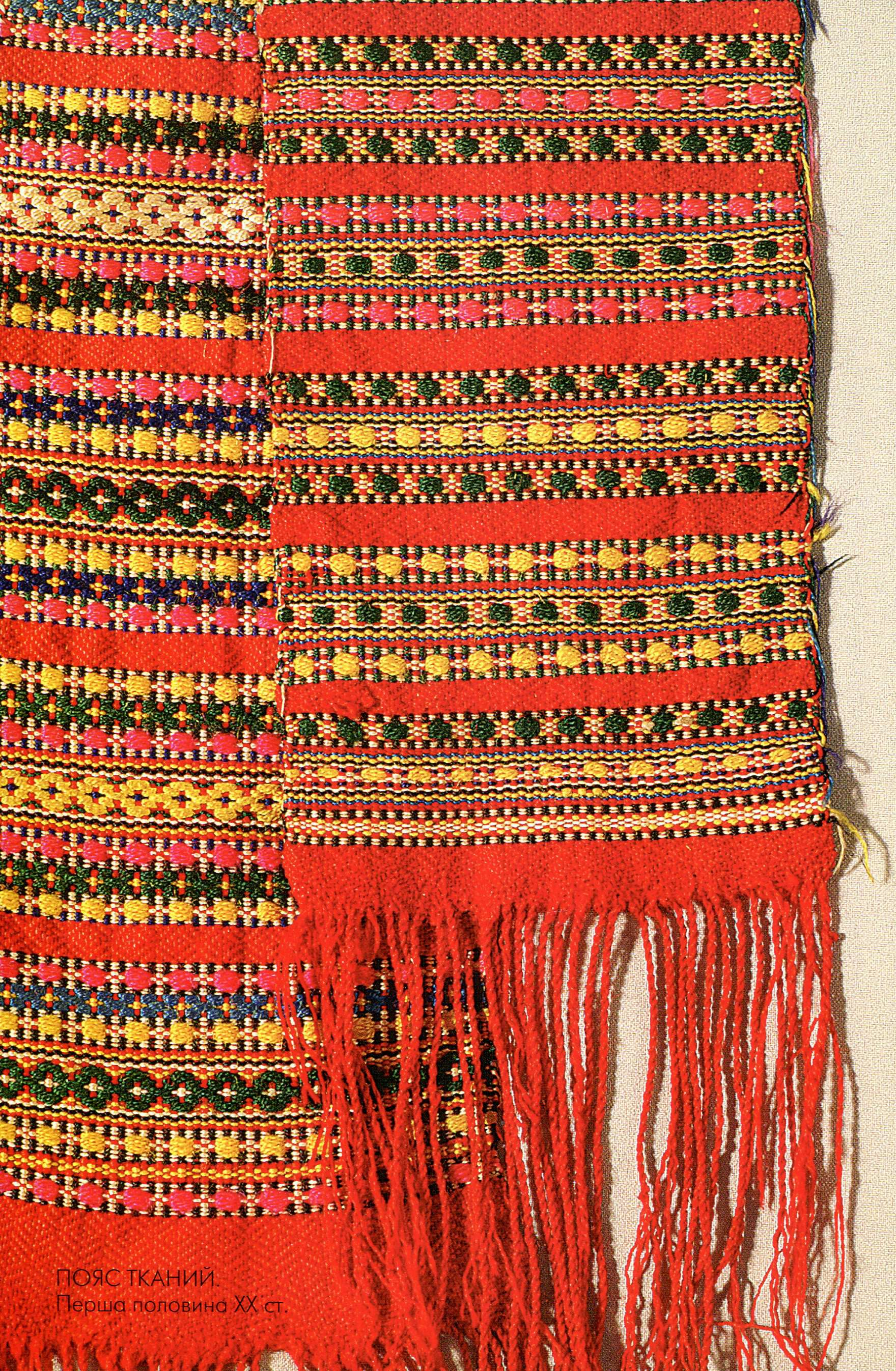
ПОЯС ТКАНИЙ. Перша половина ХХ ст.