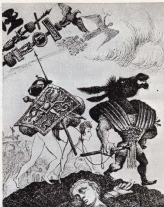
Ілюстрація до твору Апулея «Золотий осел».