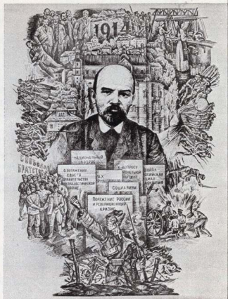
В. І. Ленін в Пороніно.