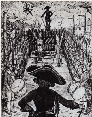
Ілюстрація до роману Ю. Тинянова «Підпоручик Кіже».