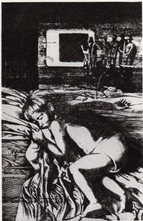
Із серії «ТБ» (телебачення) «На добраніч, діти».