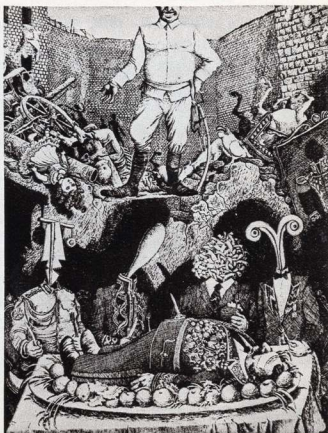
Ілюстрація до роману Г.-Г. Маркеса «Осінь патріарха».