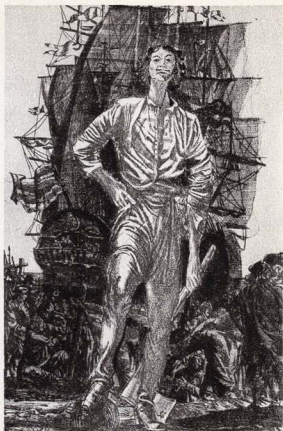
Ілюстрація до роману О. Толстого «Петро Перший».