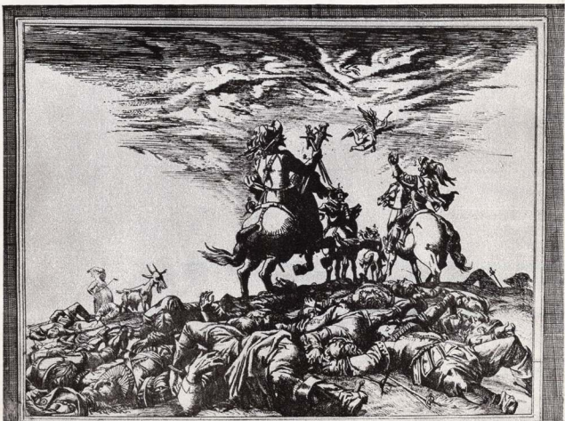
Ілюстрація до роману О. Дюма «Три мушкетери».