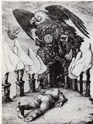
Ілюстрація до роману Г.-Г. Маркеса «Осінь патріарха».