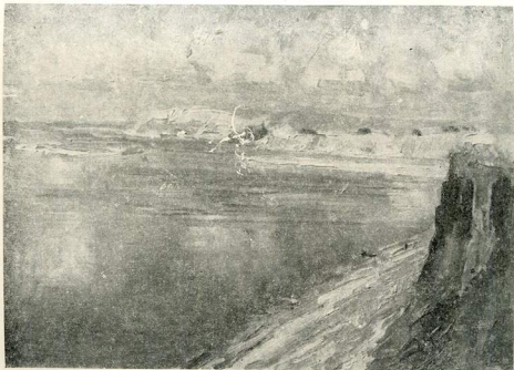
З дніпровських мотивів. Блакитний пейзаж. 1956.