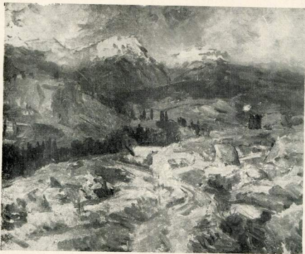
Гірський краєвид. 1951.