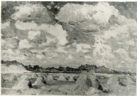
Над лугами. 1950.