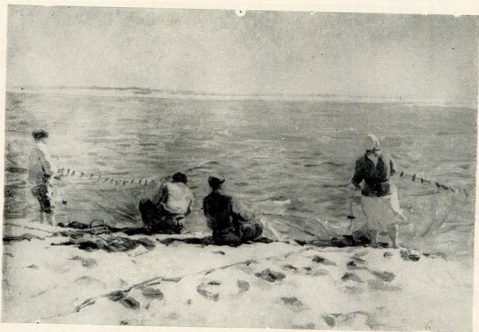
Дніпровські рибалки. 1950.