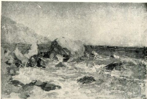
Морська блакить. 1954.