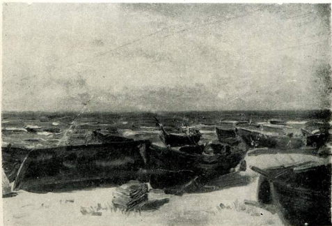
Рибальські човни. 1953.