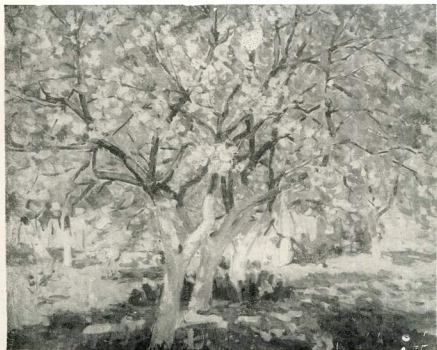
Яблуні рясні. 1949.