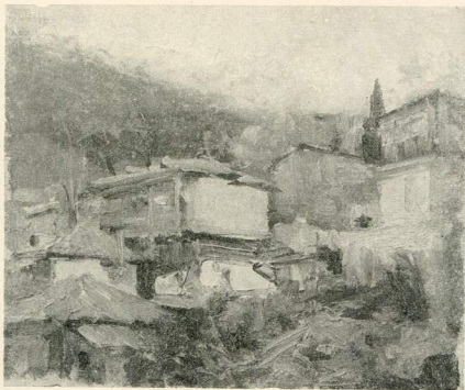
Гурзуфські будиночки. 1956.