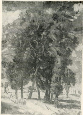
Дыхание весны, 1947.