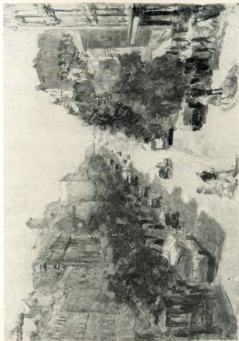
Кийвський ранок, 1947.