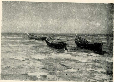
На якорях. 1953.