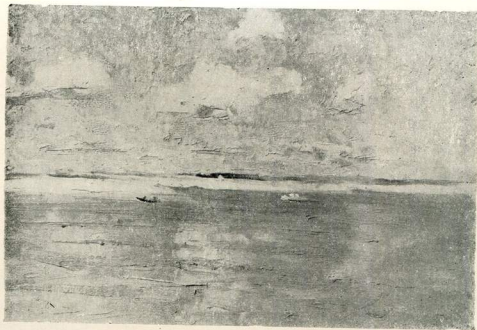
Дніпровські простори. 1956.