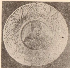
Межигірська порцеляна 2-ої пол. XIX в.: Тарілка з портретом Т. Шевченка

Межигірська фабрика була одним із останніх більших підприємств київського самоврядування і один з проявів автономного устрою українських міст, що обстоювали свою господарську і політичну незалежність від російської адміністрації. Саме у 1802 р. Києву привернено, скасоване перед тим Московією, т. зв. магдебурзьке право, себто міське право самоврядування. З нагоди цієї події київський магістрат поставив навіть пам'ятник „Відновлення магдебурзького права міста Києва“. Але цей пам'ятник, побудований київським архітектором Андрієм Меленським в парку над Дніпром, дуже мозолив очі Москві. Щоб втерти всякі сліди того автономного устрою Києва, російська адміністрація в пол. XIX ст. придумала хитрий спосіб „перехрестити“ цей пам'ятник на „Пам'ятник хрещення Русь“. Мета була побожна і так ніхто не протестував, не підозрюючи, яка властива мета криється в лукавих головах російських губернаторів. Під цією назвою „Пам'ятник хрещення Русь“ колона фігурує ще й досі по різних підручниках... також і українських!