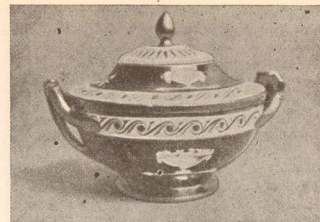
Корецька порцеляна: ваза