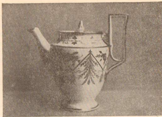
Корецька порцеляна: З кавового сервісу

зей у Варшаві і Кракові, Музей Орд. Замойських у Замосто, Музей Чорторських у Кракові. На українських землях гарну збірку мав Мистецько-Промисловий Музей у Львові, що донедавна був у польській адміністрації. При своїх студіях цих усіх збірок волинської порцеляни, автор особливо скористав із львівських збірок, завдяки ласкавості б. директора музею п. Теслі. Додучені тут фотографії волинської порцеляни, виконував автор безпосередньо з самих музейних експонатів.