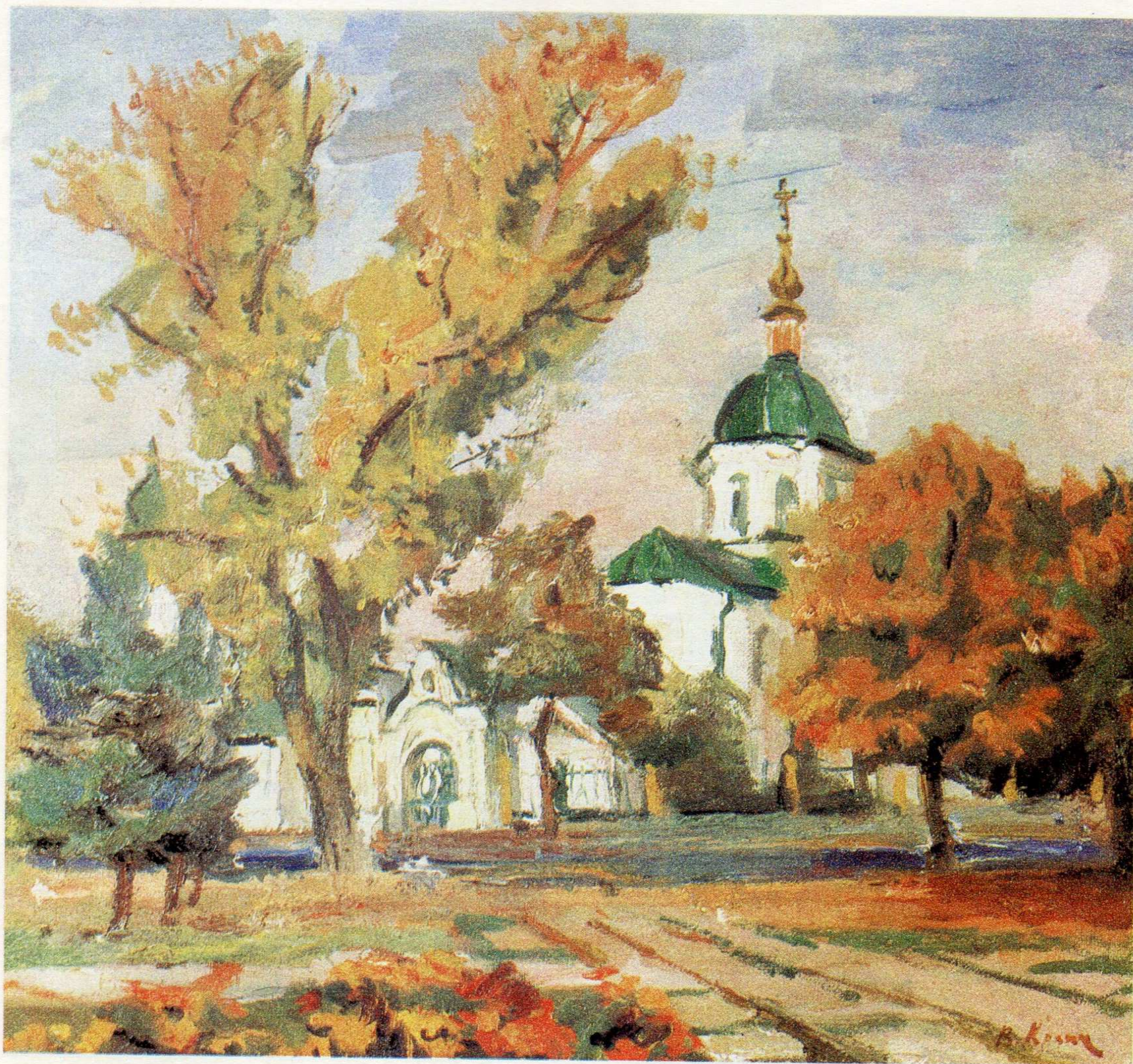
Іллінська церква. п.о., 65×70,5, 1992 р.