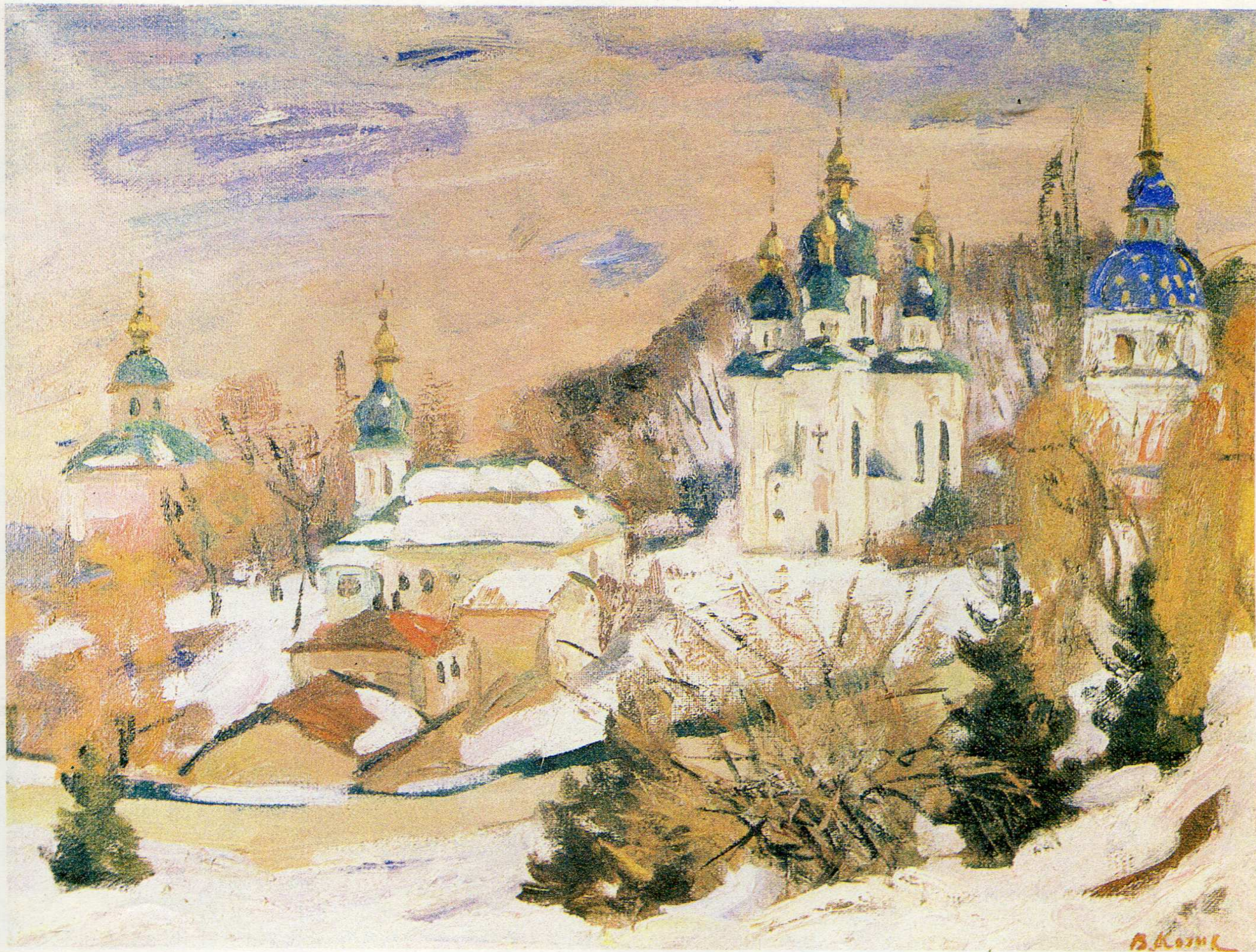
Зима у Видубичах. п.о., 60×80, 1993 р.