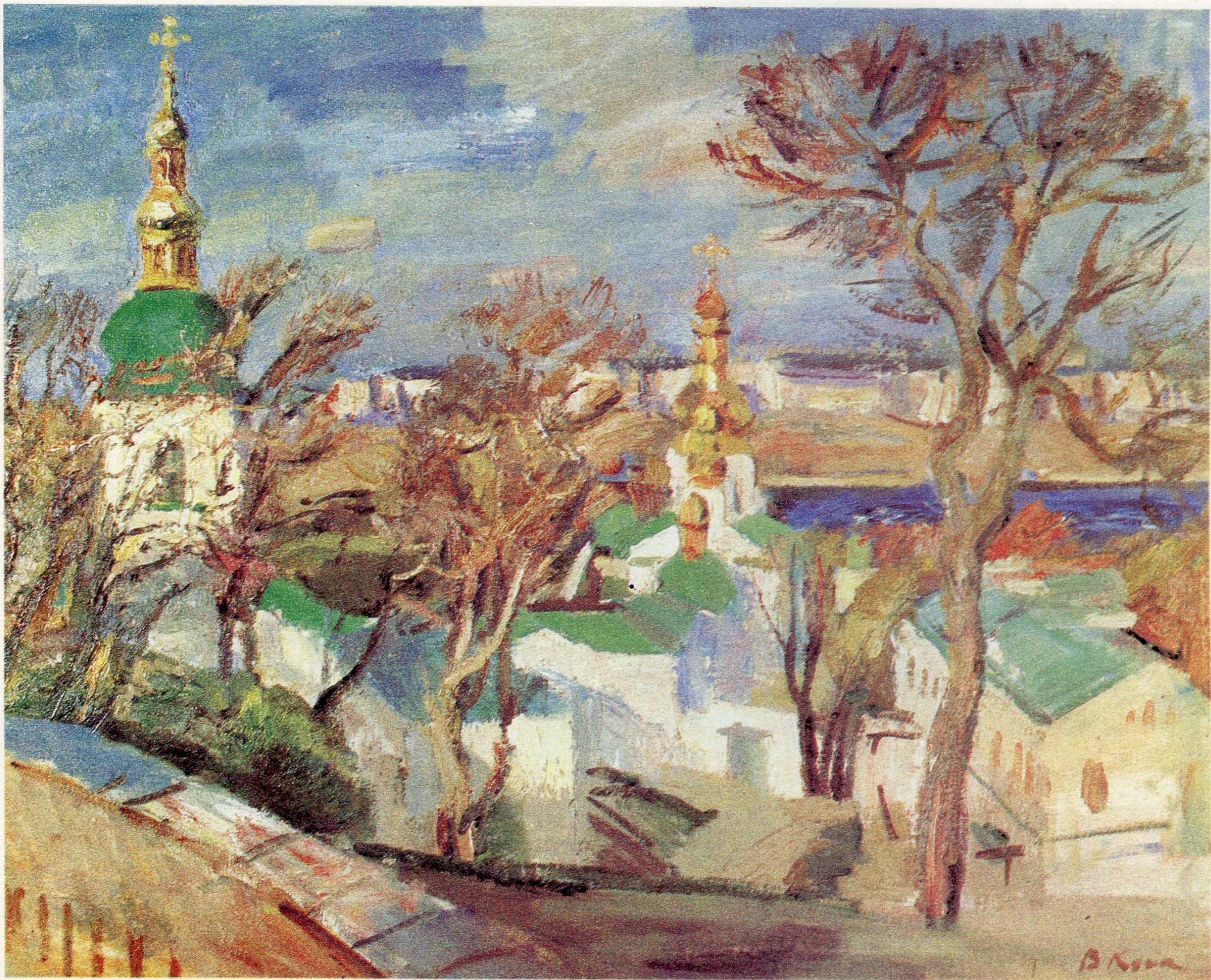
Дорога до печер. п.о., 65×80, 1991 р.