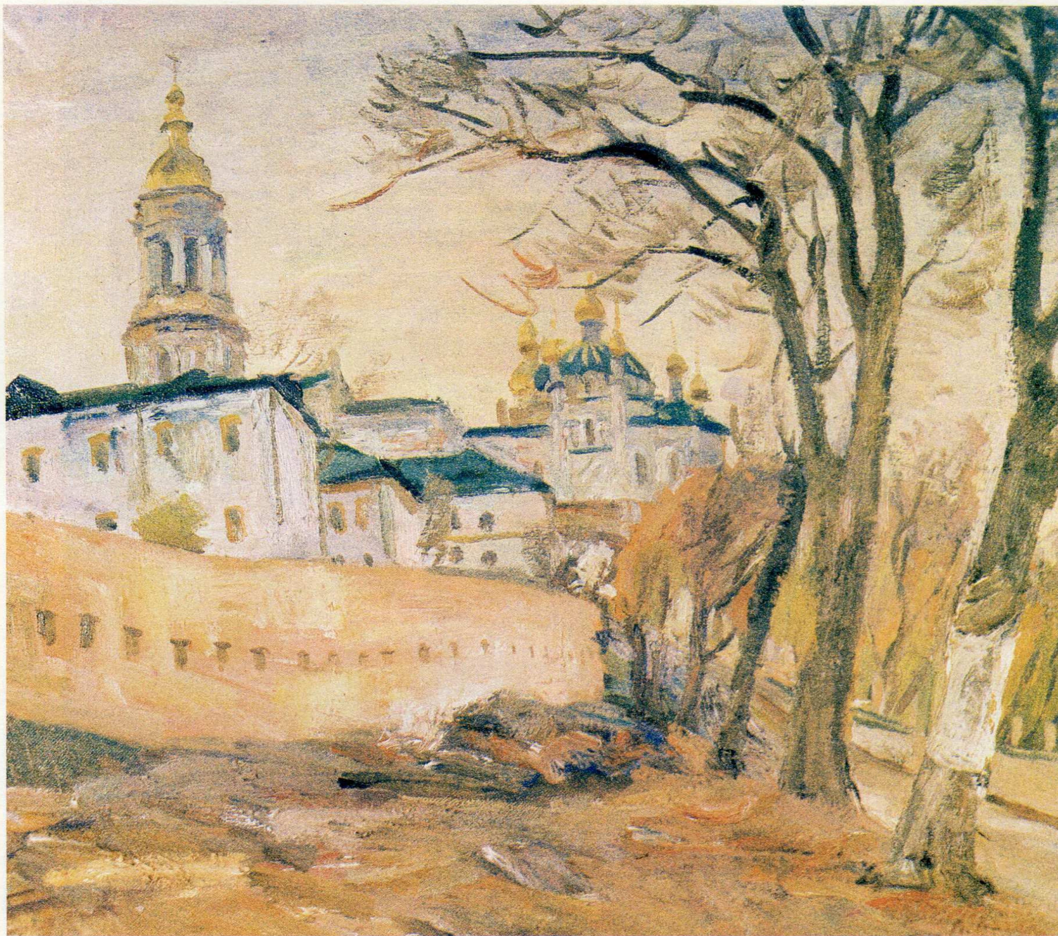
Лаврські мури. п.о., 70×80, 1992 р.