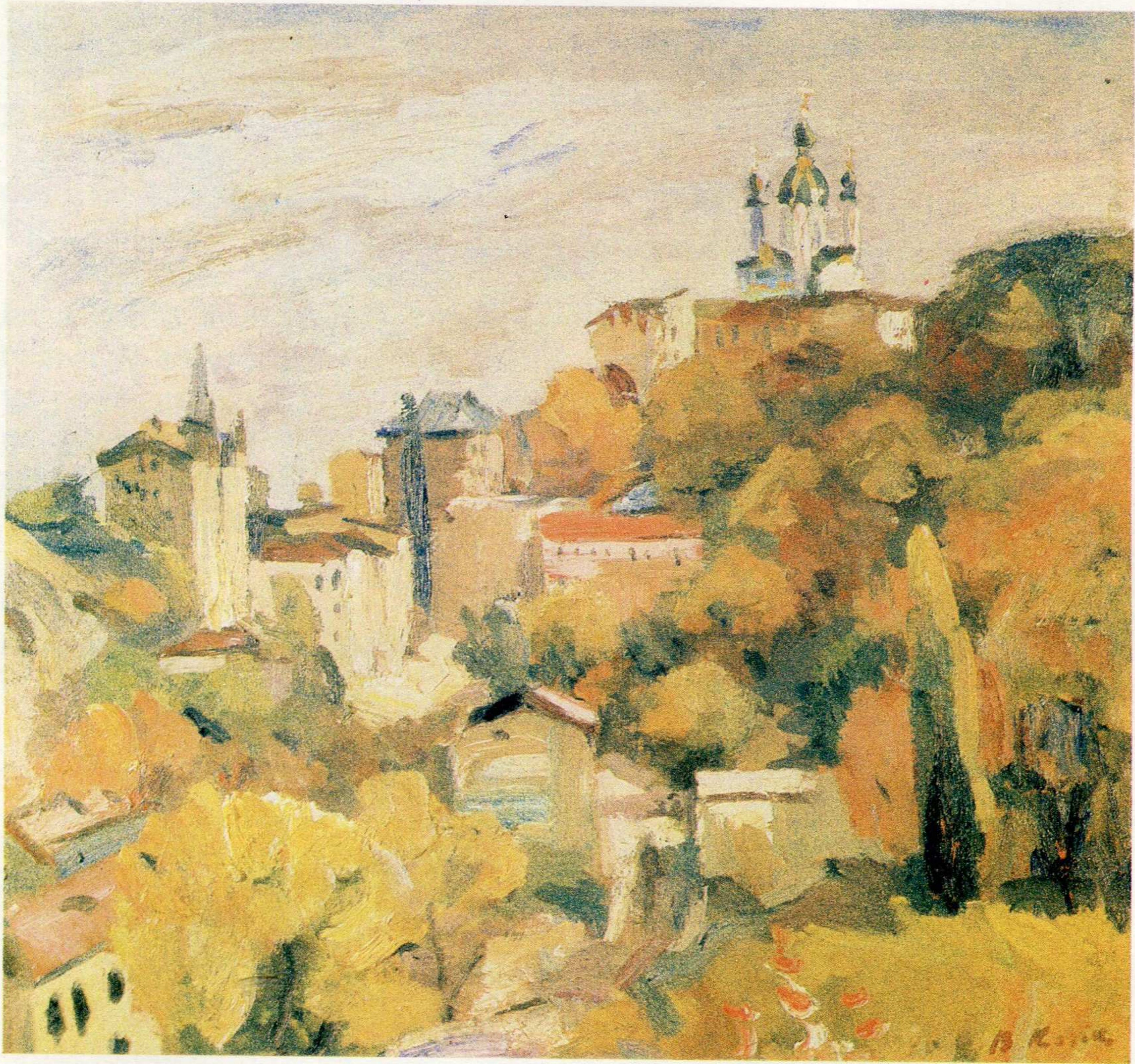
Старокиївська гора. п.о., 59×64, 1990 р.