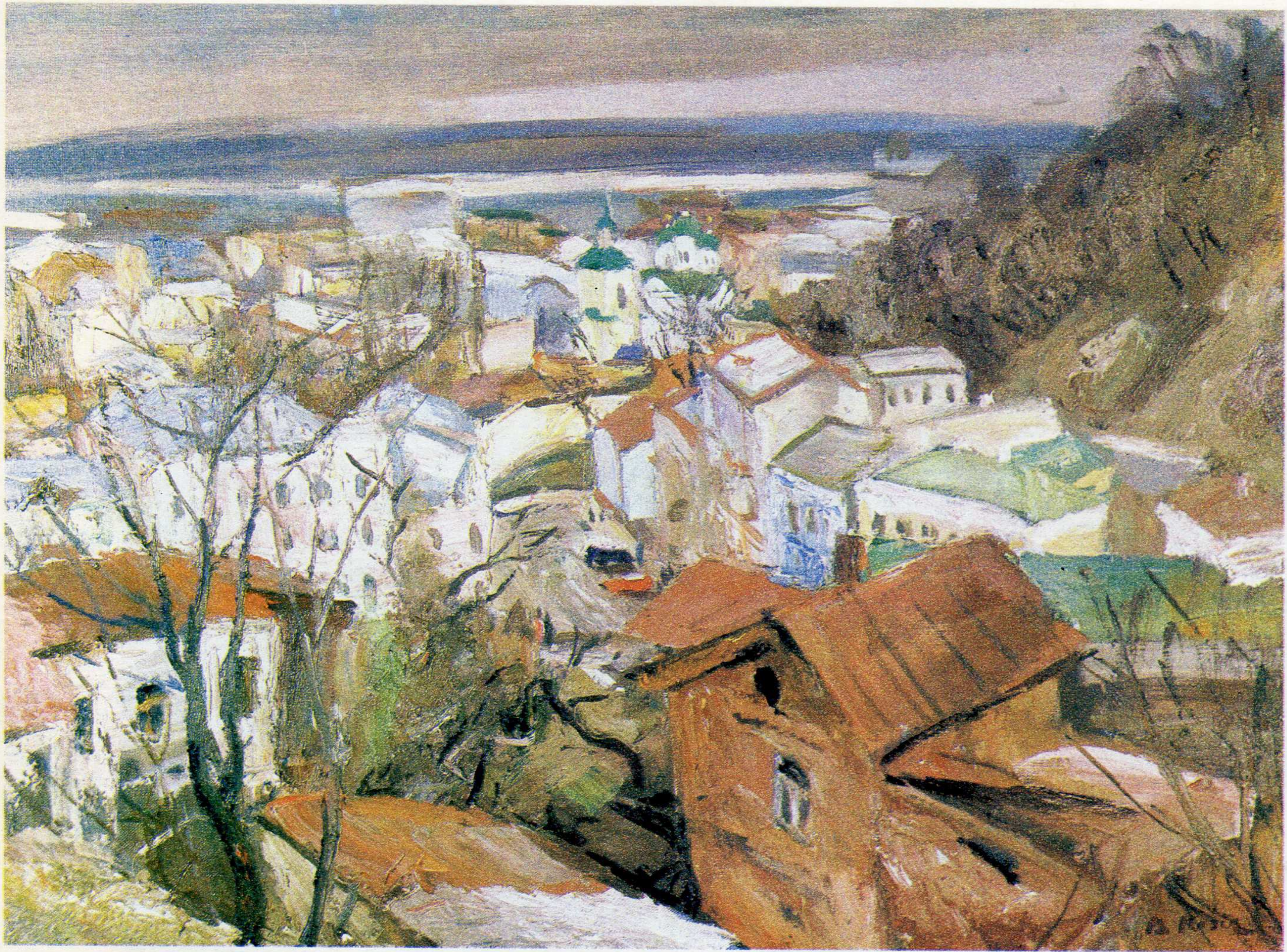
Поділ. п.о., 60×73, 1993 р.