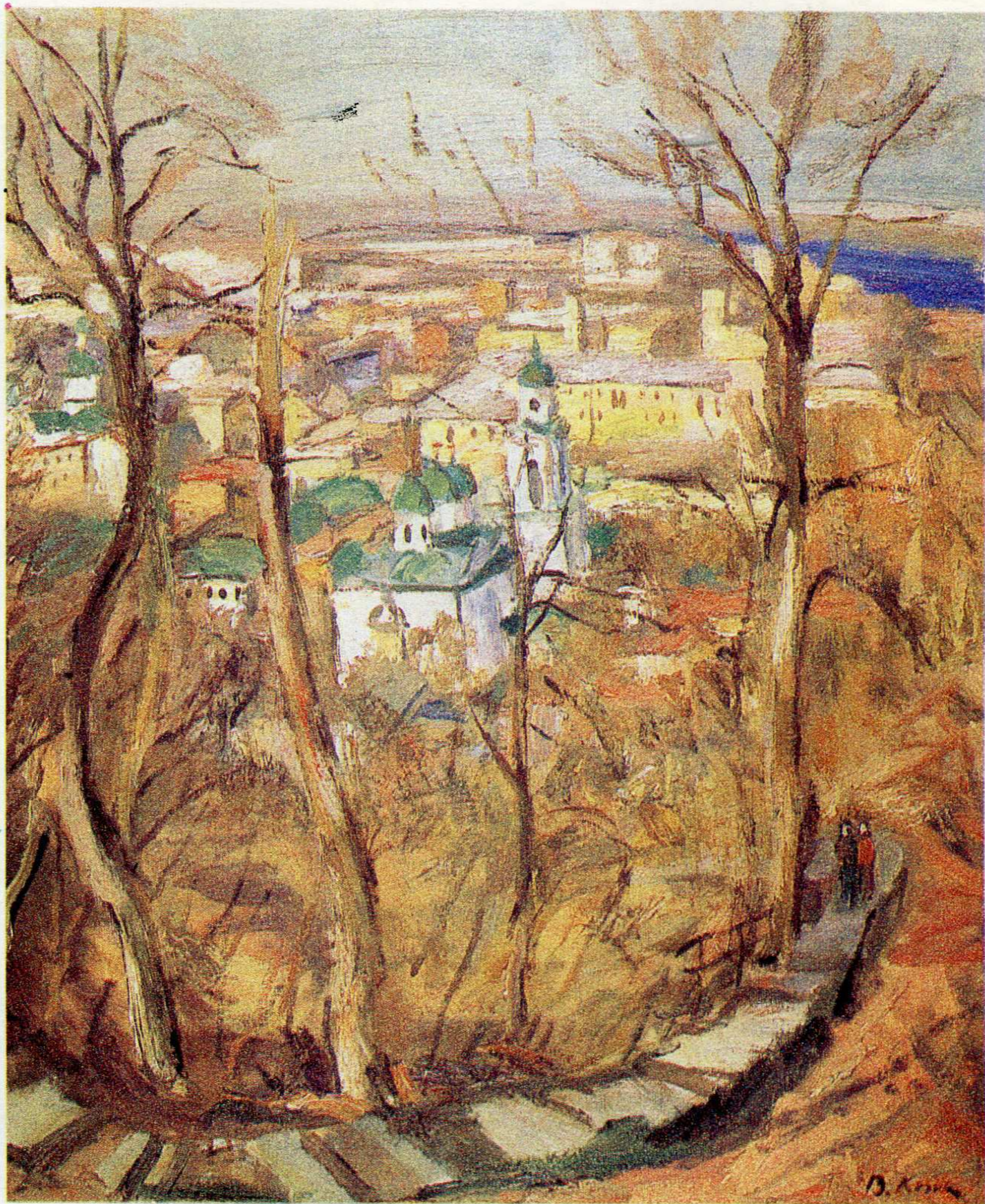
Весняний Поділ. п.о., 73×60, 1993 р.