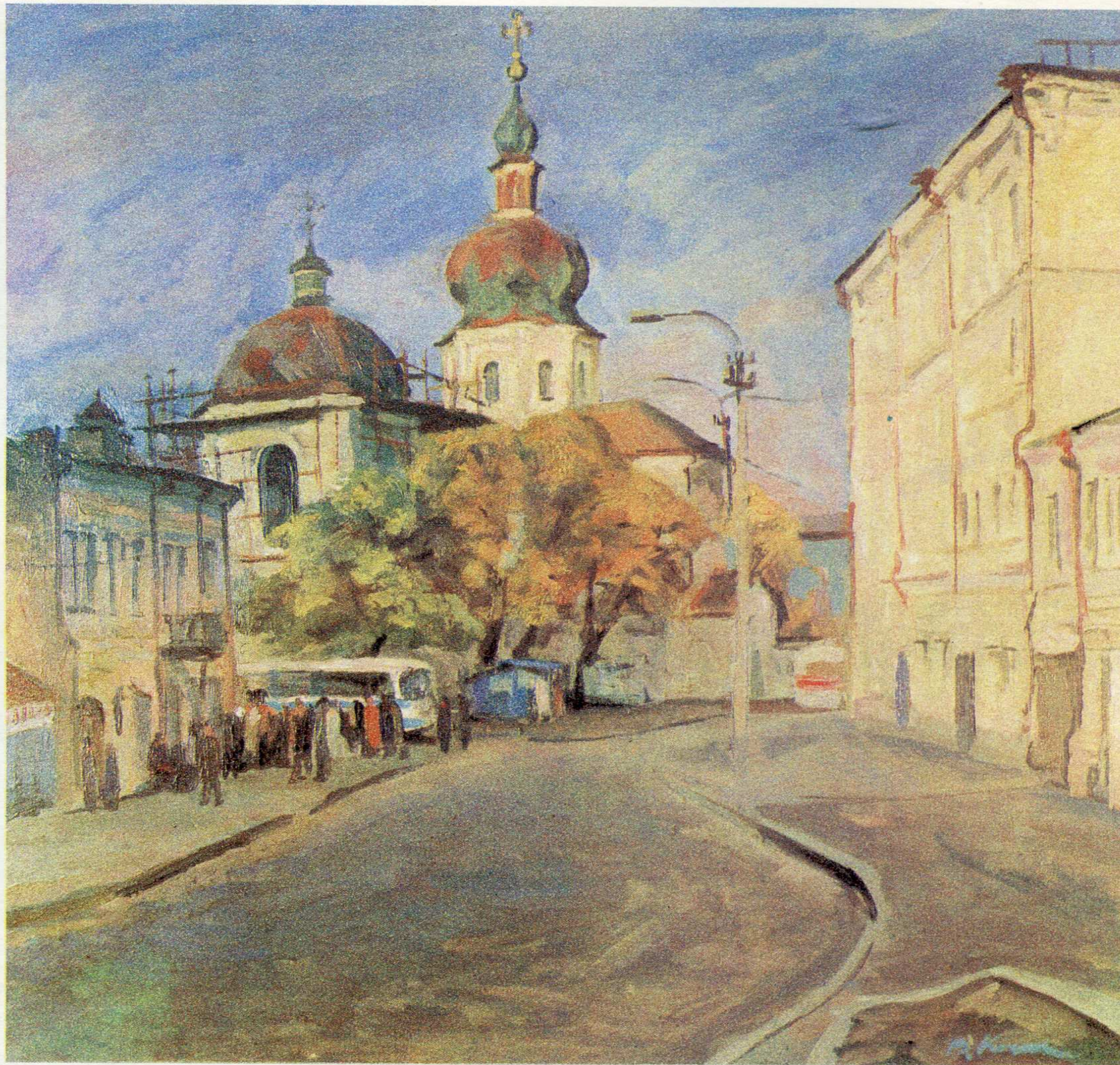
Церква Миколи Притиска. п.о., 75×80, 1987 р.