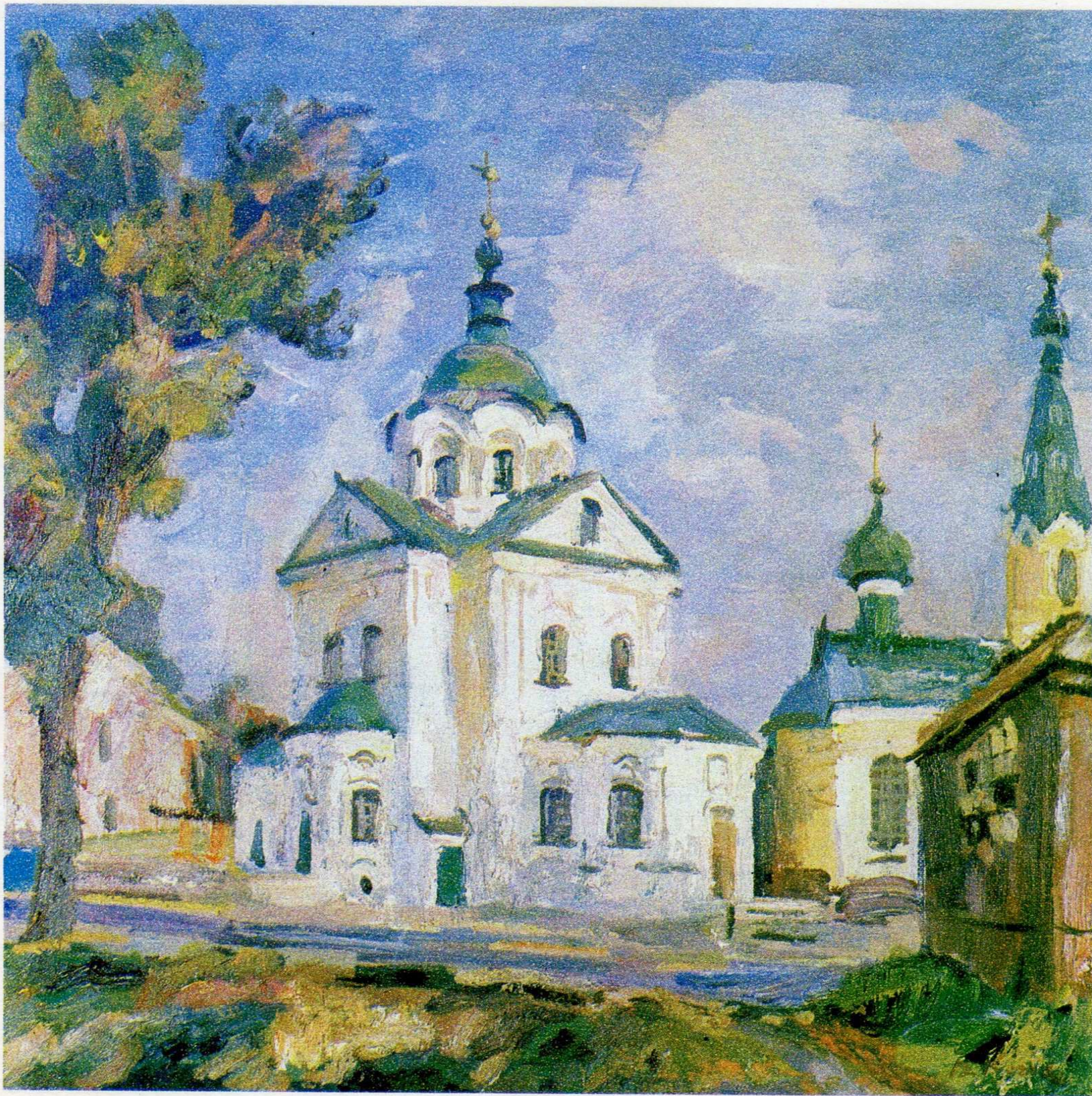
Церква Миколи Набережного. п.о., 70×75, 1993 р.