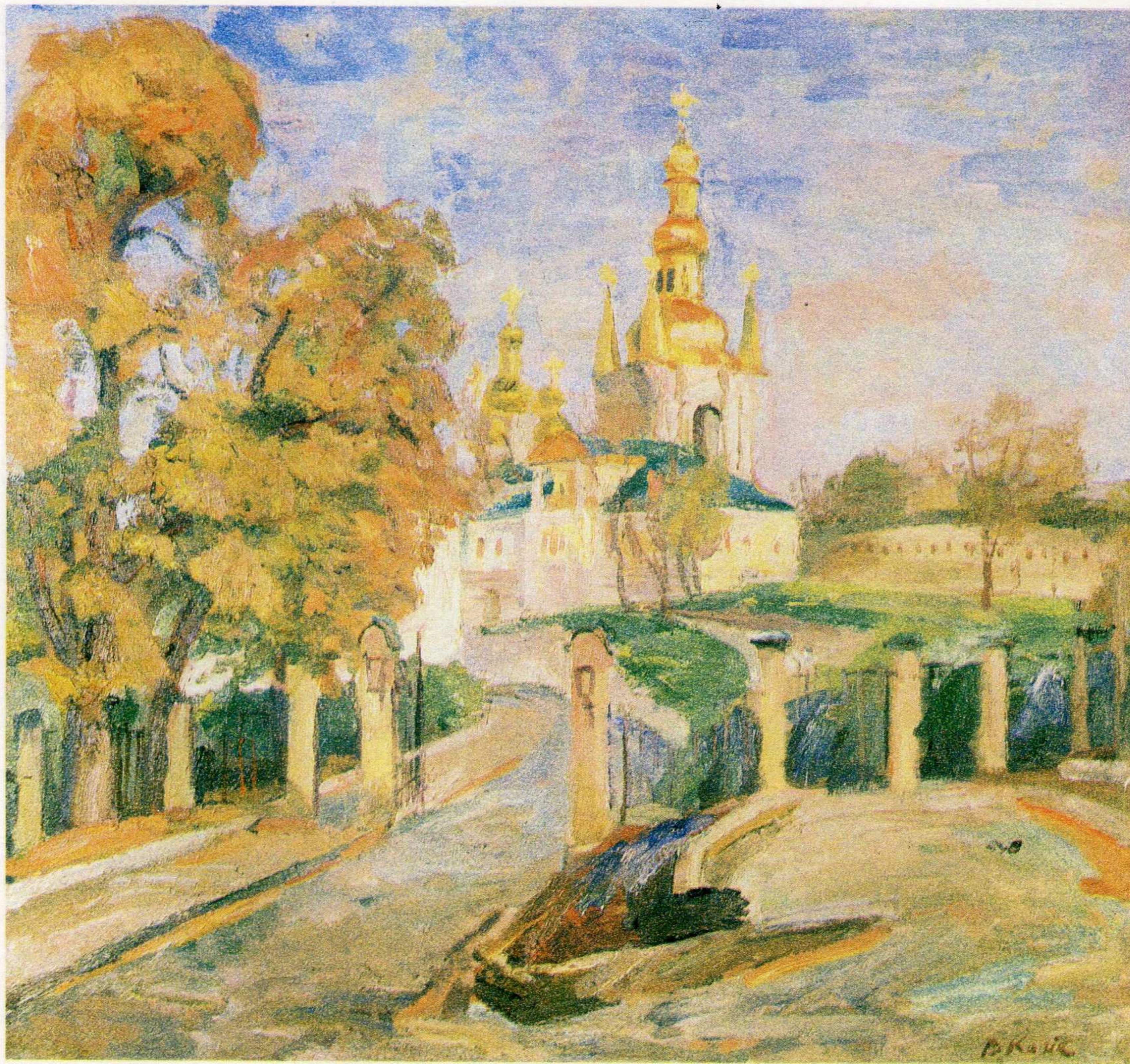
Дзвіниця Різдно-Богородичної церкви. п.о., 75,5×80, 1993 р.