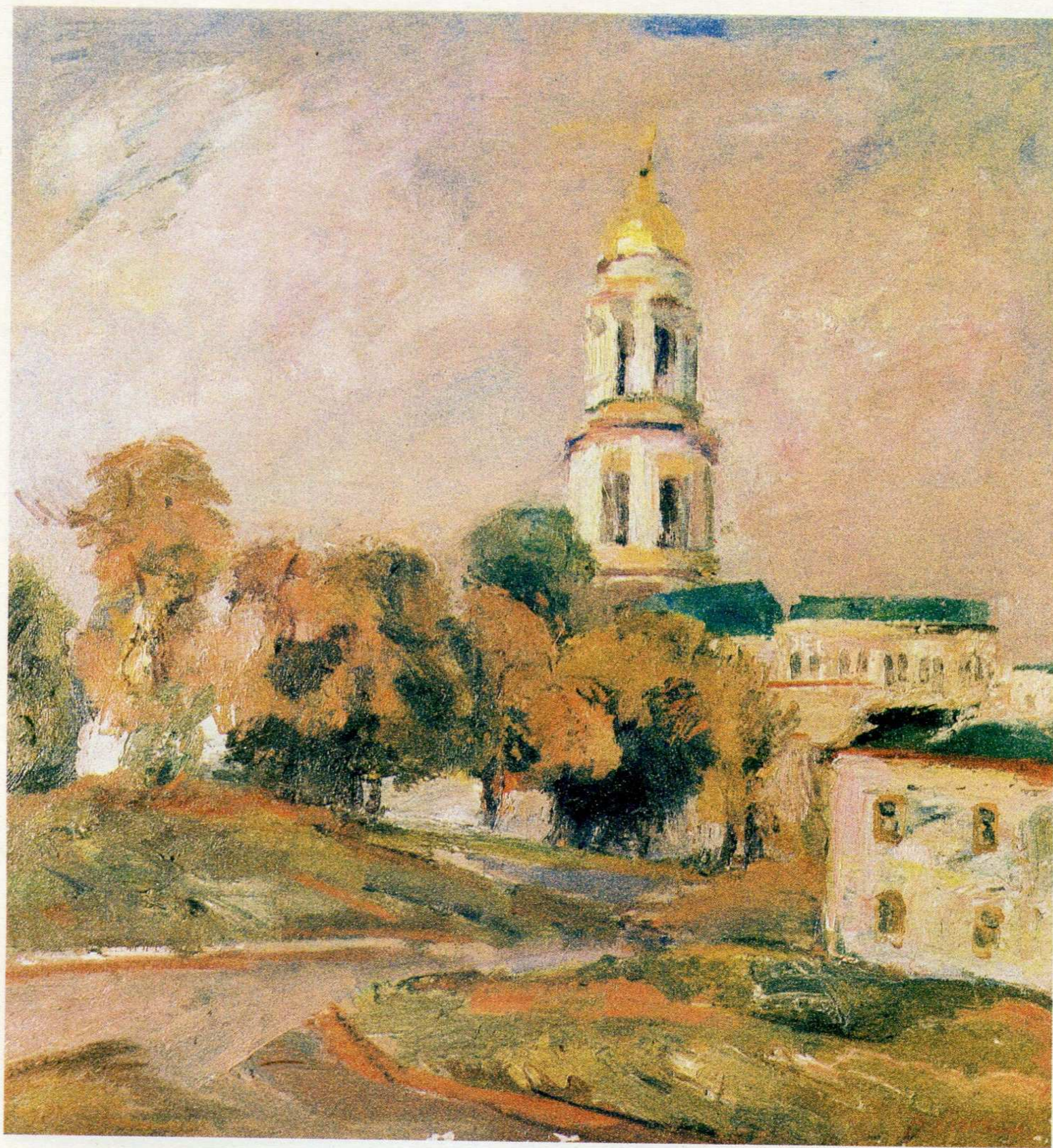
Дзвіниця Києво-Печерської Лаври. п.о., 75×70, 1992 р.