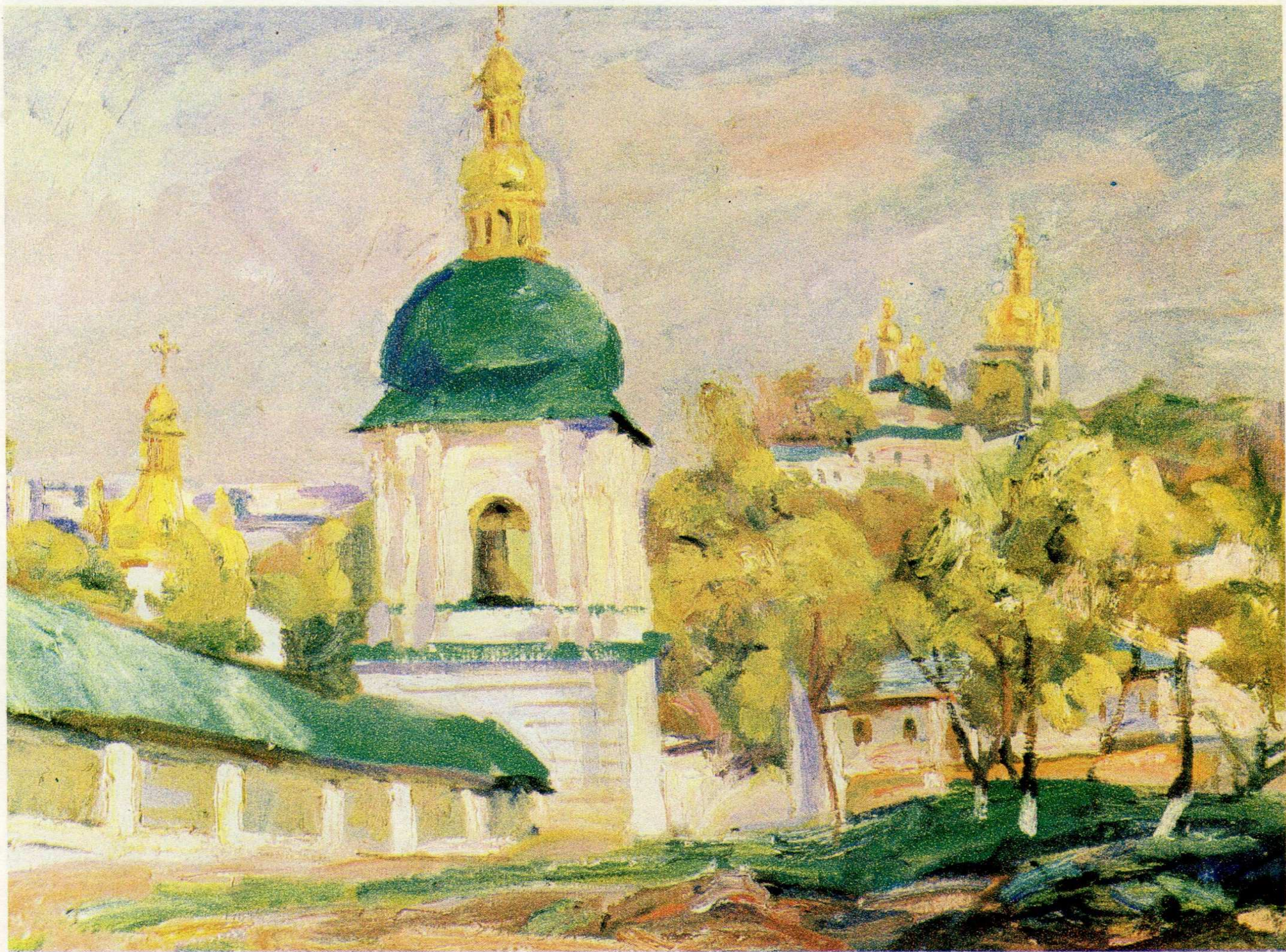
Ближні Печери. п.о., 61×80,5, 1992 р.