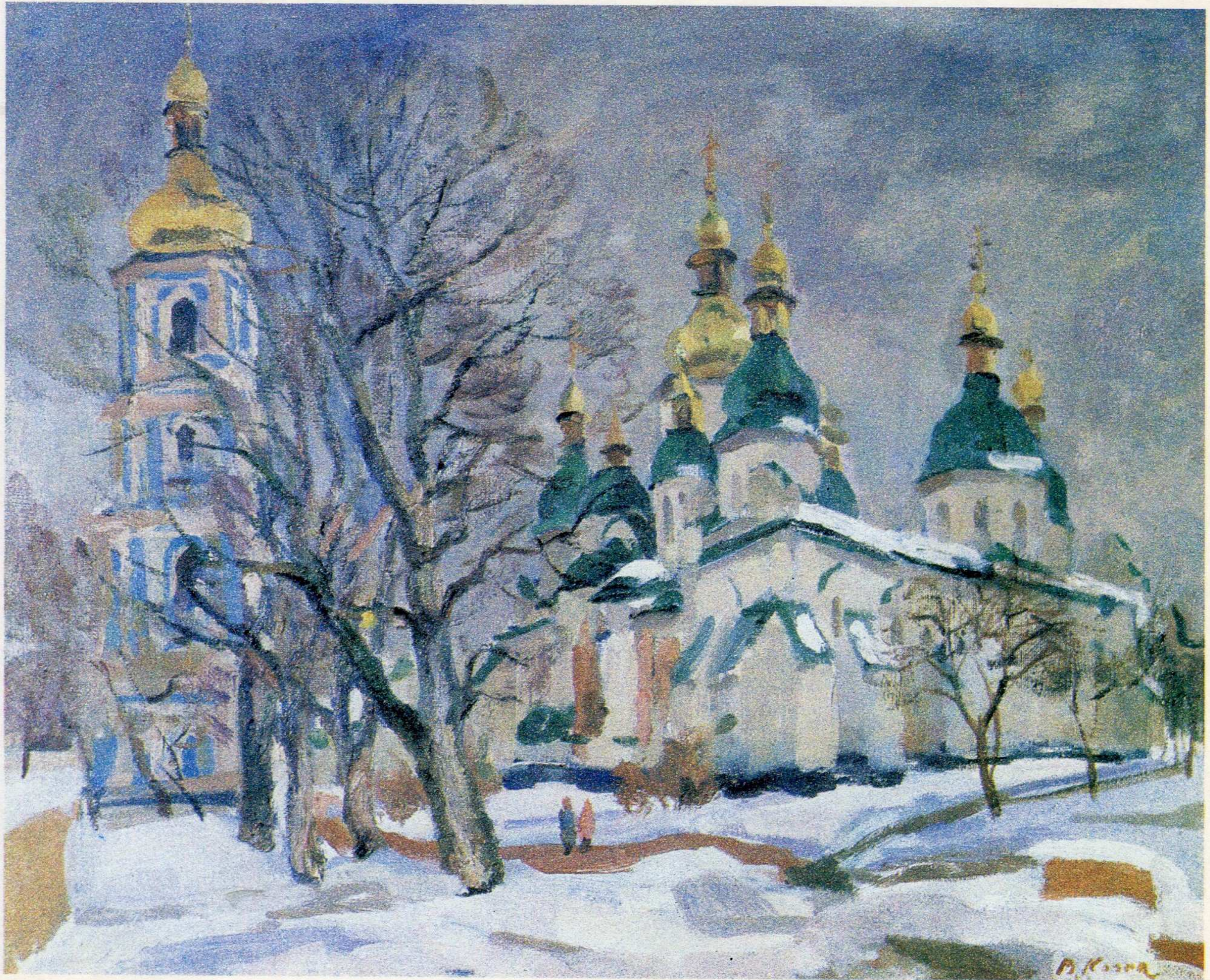
Софія Київська. п.о., 60×81, 1994 р.