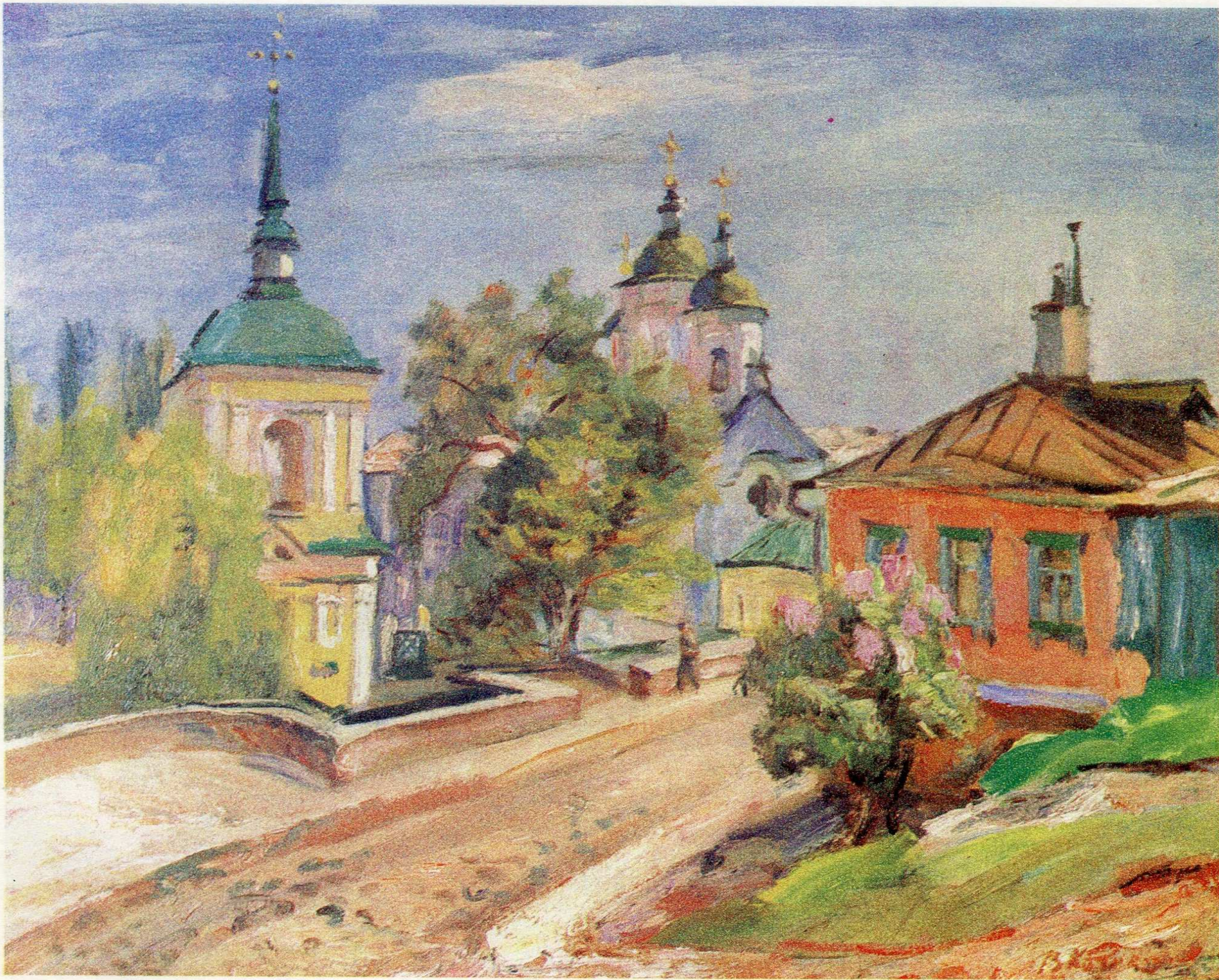
Покровська церква на Подолі. п.о., 65×81, 1993 р.