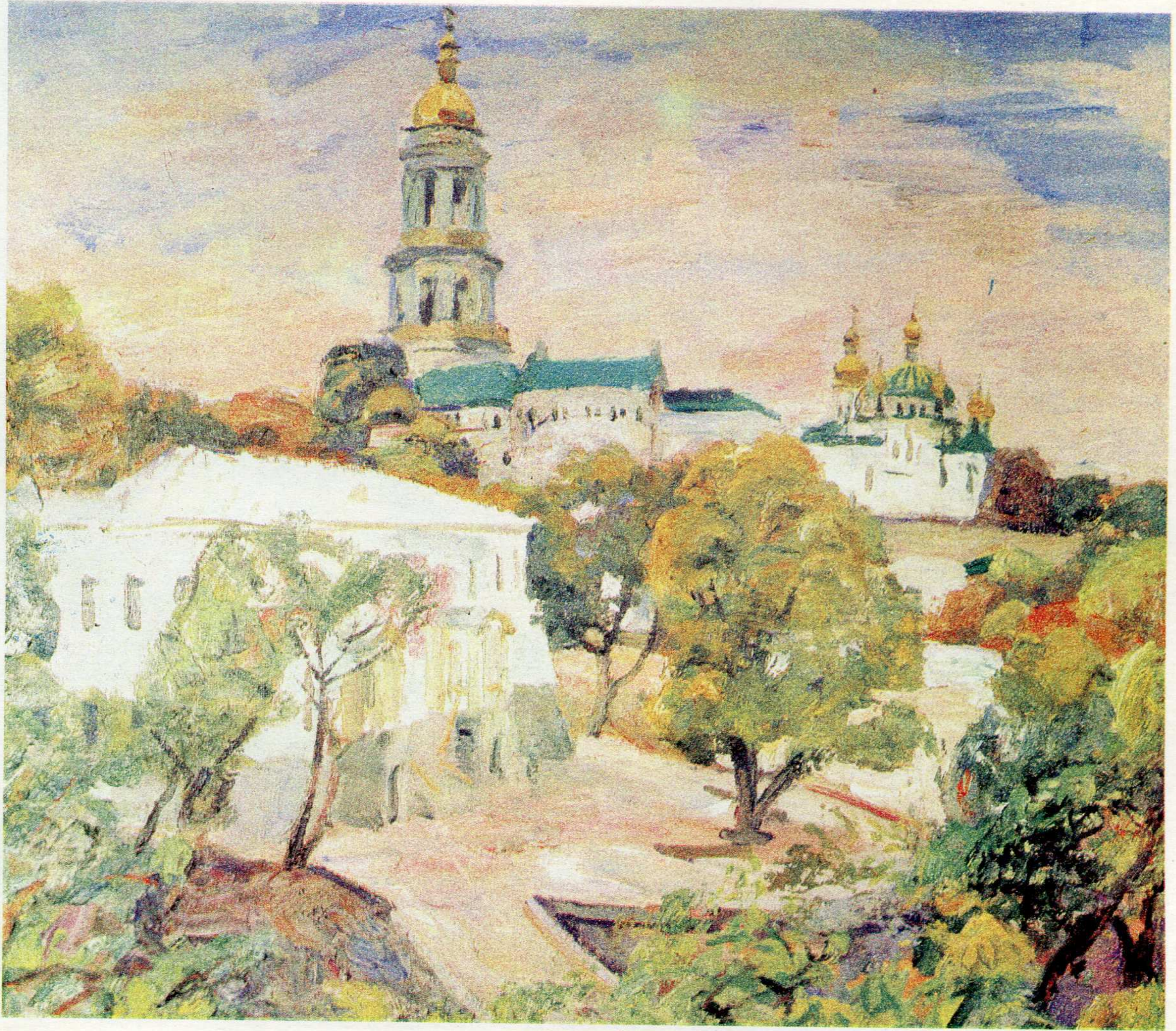
Києво-Печерська Лавра. п.о., 80×90, 1992 р.