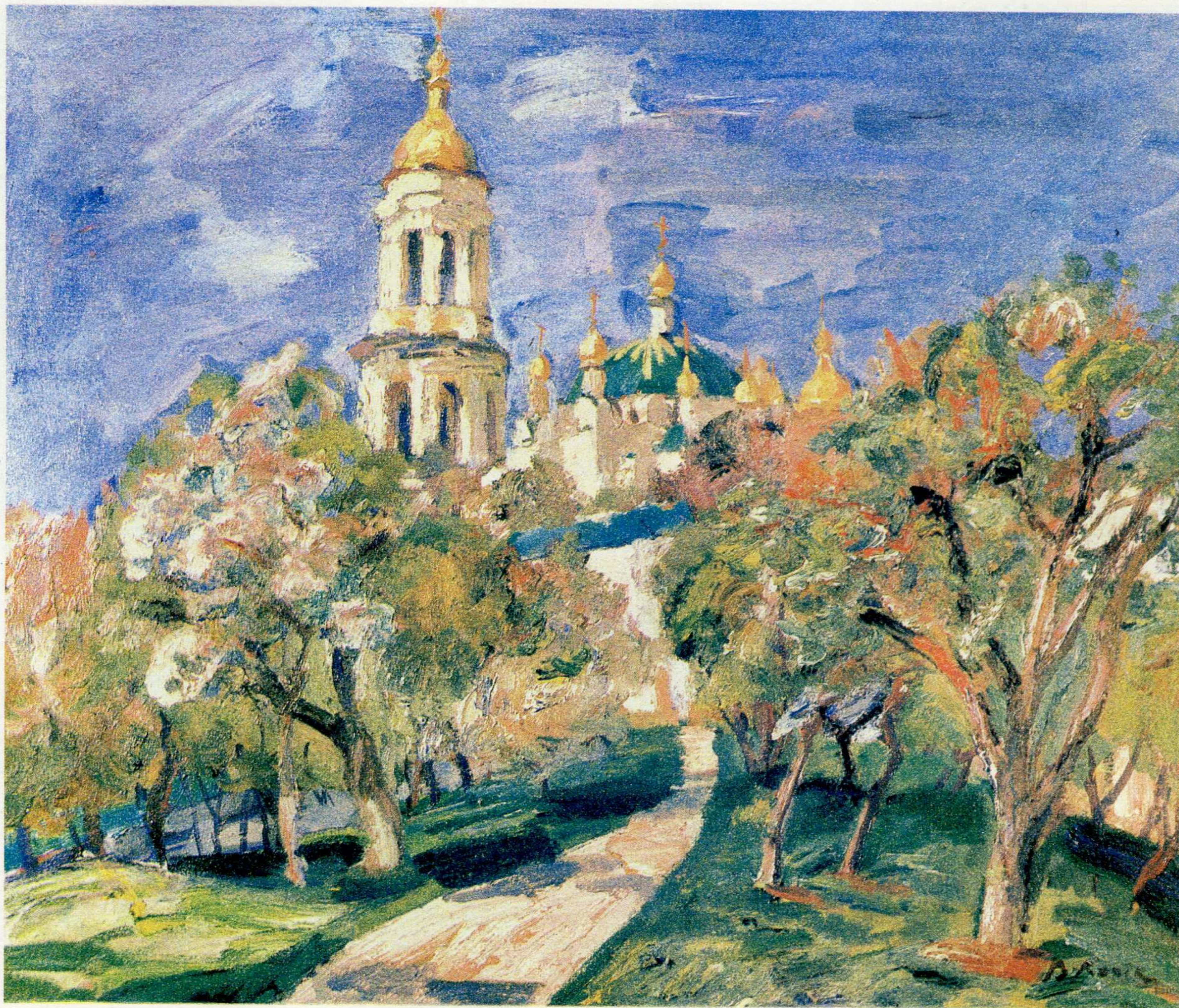
Чернечий сад. п.о., 65×77, 1991 г.