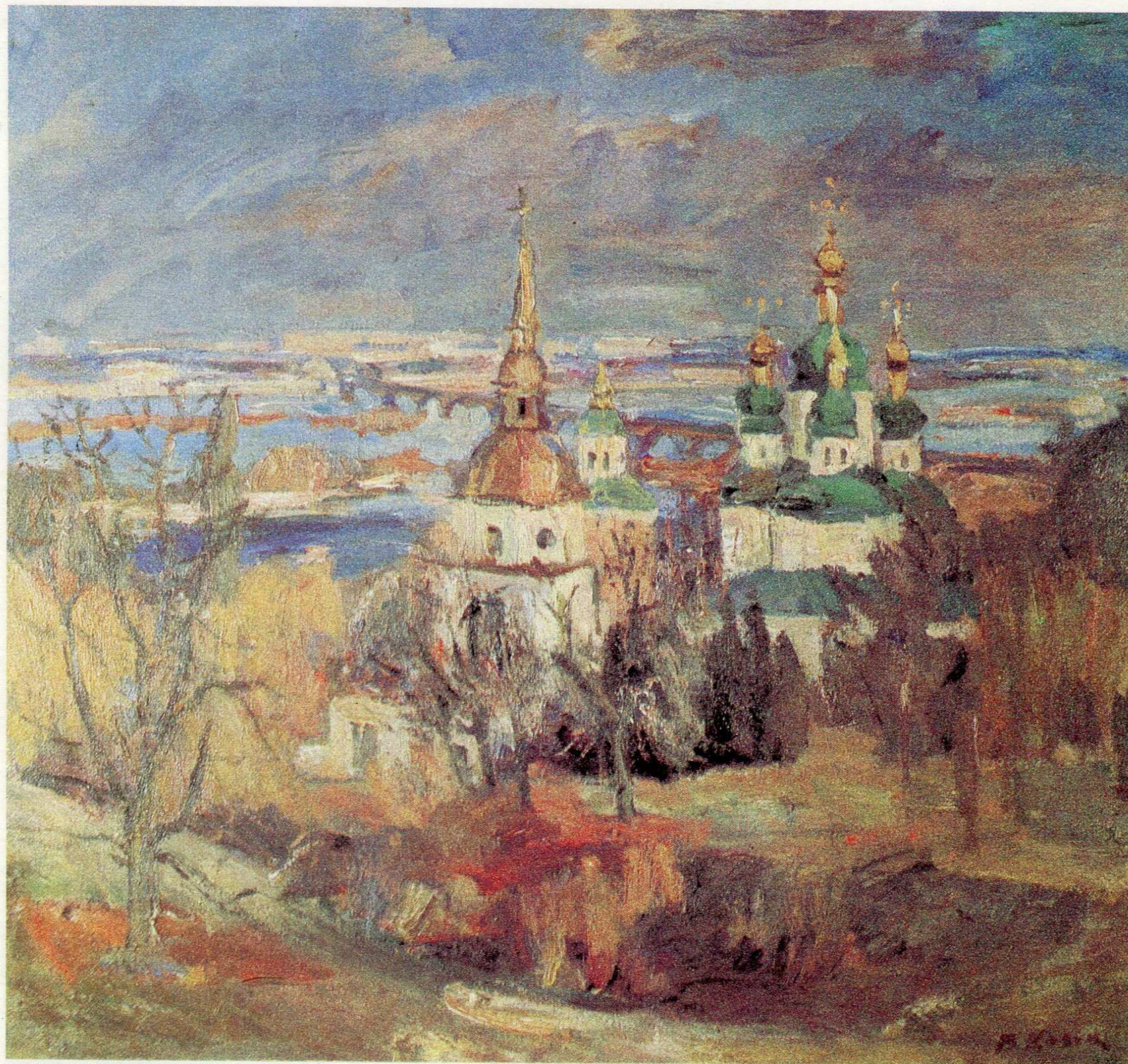
Осінні Видубичі. п.о., 80×85, 1991 р.