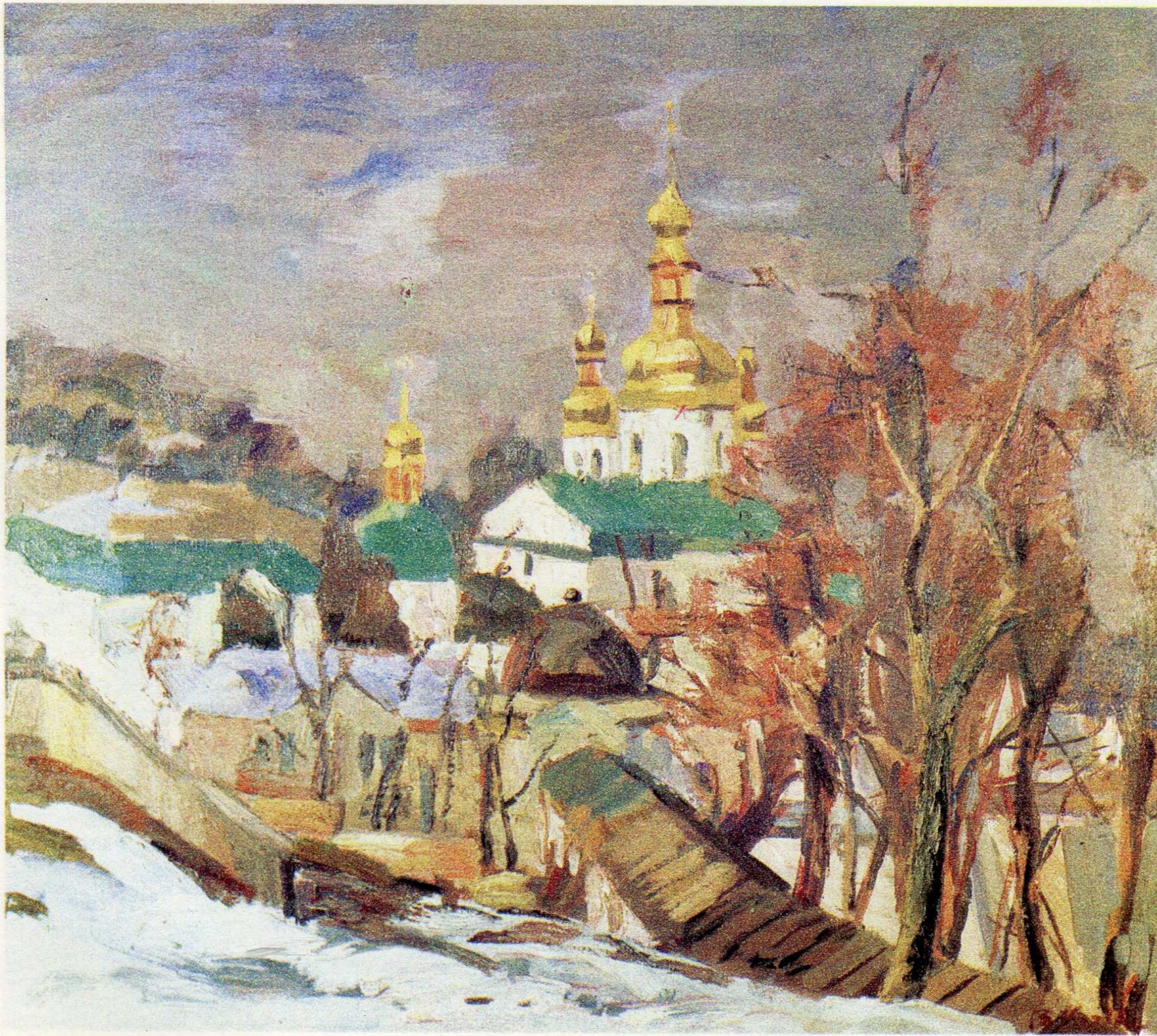
Хрестовоздвиженська церква. п.о., 75×85, 1993 р.