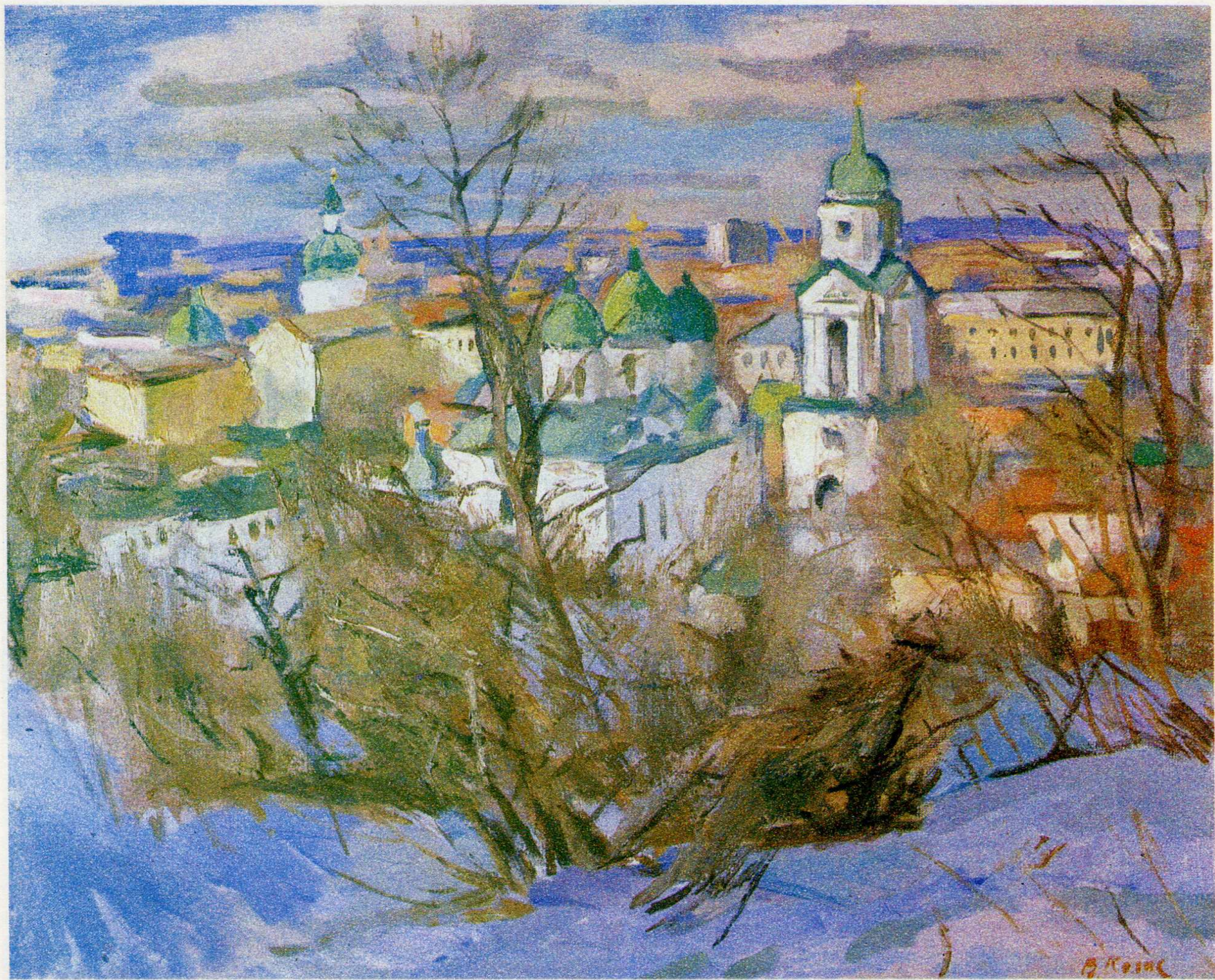
Фролівський монастир. п.о., 60×73, 1994 р.